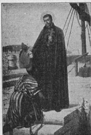
Sv. Peter Klaver, apostol zamorcev, prosi za nje in za naše podjetje!