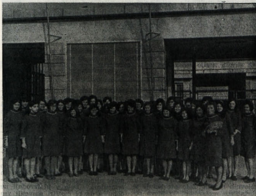
Pevski zbor »Beti«, ki se nam je predstavil na proslavi za Dan žena

V soboto in nedeljo bodo v Metliki kvalifikacije za slovensko košarkarsko ligo. Nastopili bodo klubi iz Meblo — Nove Gorice, Radovljice, Medvod in »BETI« Metlika. Igrali bodo na Pungrtu. Prosimo vse ljubitelje košarke, da se udeležijo tekm v čim večjem številu.