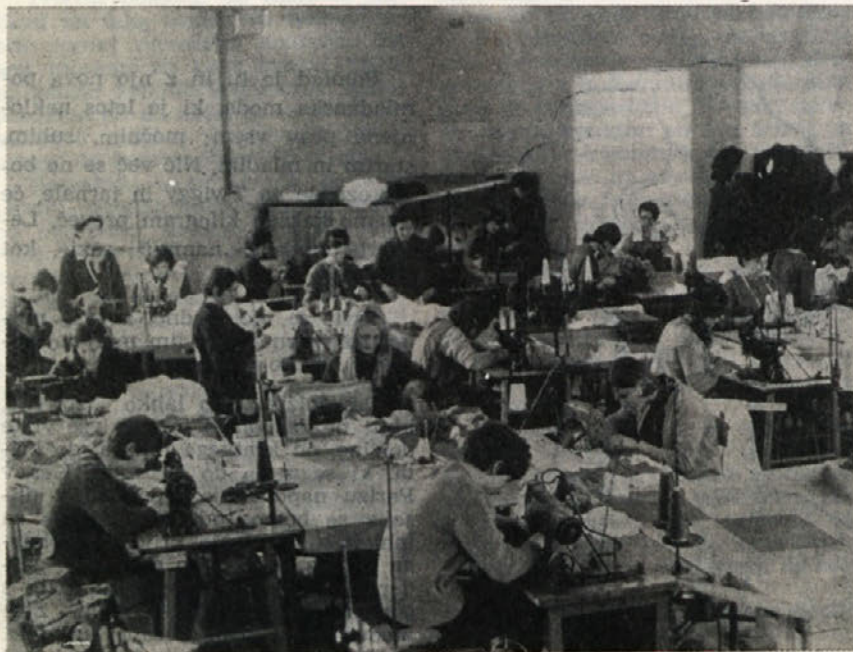
Inštruktorice med učenkami v učilnici za praktični pouk