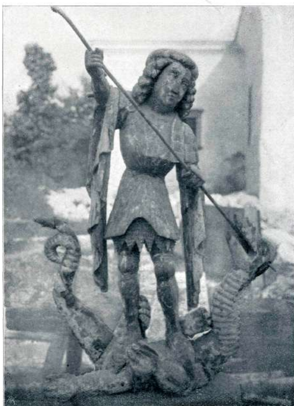
Kip sv. Jurija.

2. Župna cerkev v Mirni Peči. — Prezbiterij bogat poznogotski, zvonik v spodnjem delu tudi poznogotski, kar dokazuje gotskoprofiliran zaokrožen vhod pod zvonik; ladja vmes je iz 18. stoletja; mogoče je sicer, da se pod sedanjo zunanjščino skrivajo starejši zidovi, kar se bo videlo pri podiranju. Cerkev je premajhna, zato jo je treba povečati. Pri tem bosta ostala ohranjena zvonik in prezbiterij, glavna ladja pa bo šla med njima pravokotno na sedanjo glavno os cerkve. Na isti način so ohranili prezbiterij in zvonik cer-