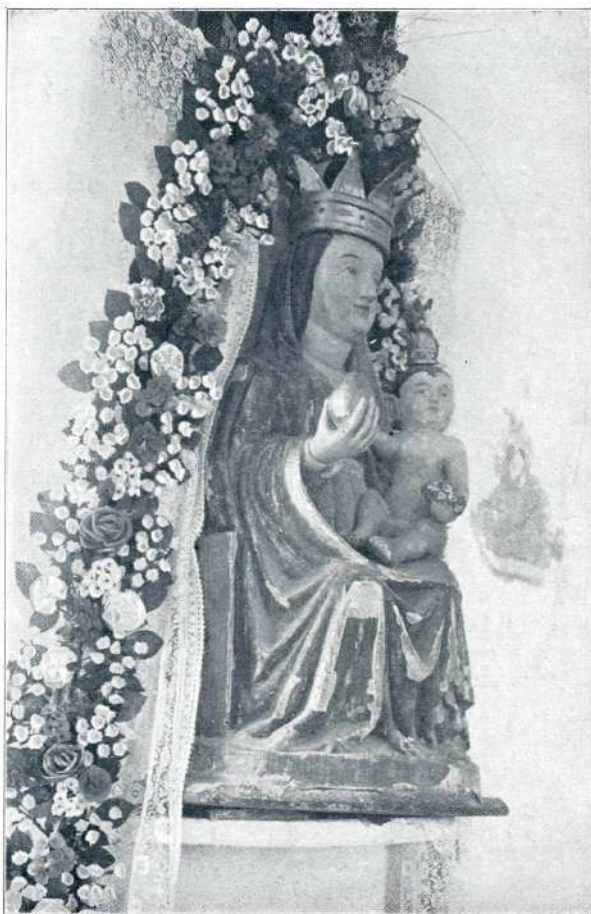
Kip Matere božje.