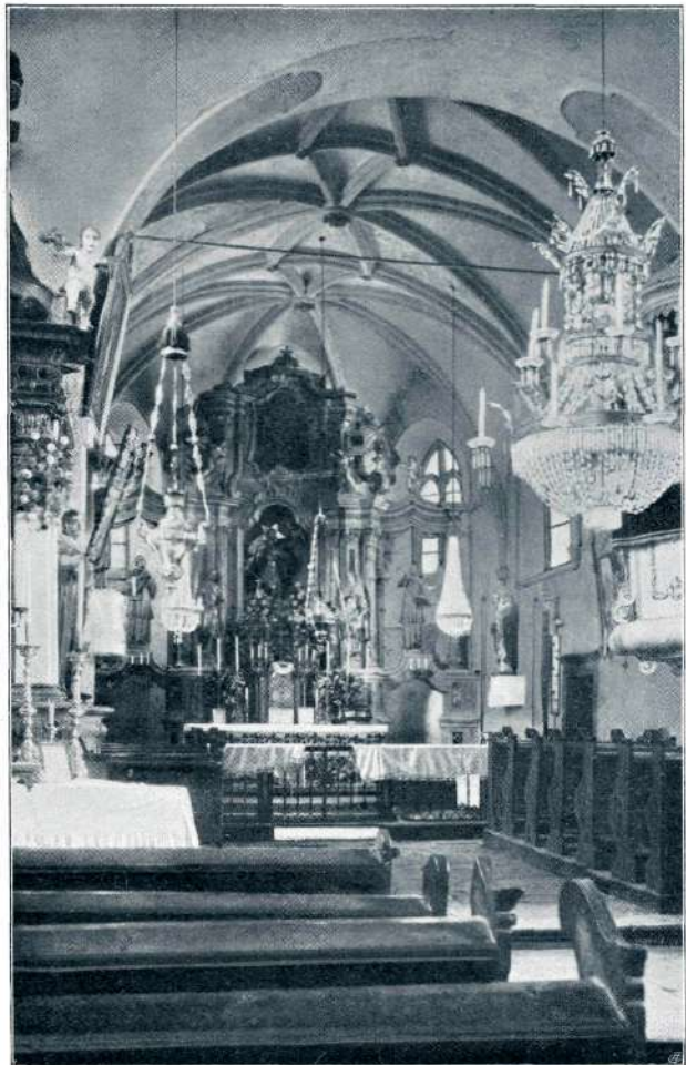
Cerkev v Mirni Peči.

čuvstvo, javi se nam kot razpoloženje in je ravno zato občečloveški in najbolj dostopen. — Spomenik preteklosti je bil pa po veliki večini ob svojem začetku namenjen kakršnemukoli praktičnemu namenu, porabi in pogosto ima tudi še danes porabno vrednost in vlogo. In tudi na moment praktične porabe se mora ozirati spomeniško varstvo. Že iz tega je razvidno, da stališče spomeniškega varstva ne more biti v vsakem slučaju enostavno ali samoposebi jasno; večje število vrednostnih momentov ima za posledico več ozir-rov; in v vsakem slučaju sorazmerno vse zadovoljiti ni vedno lahko, je celo nemogoče. Kakor smo videli, moramo računati z momentom zgodovinske vrednosti; ta vrednost je d o k u m e n t a r i č n a,