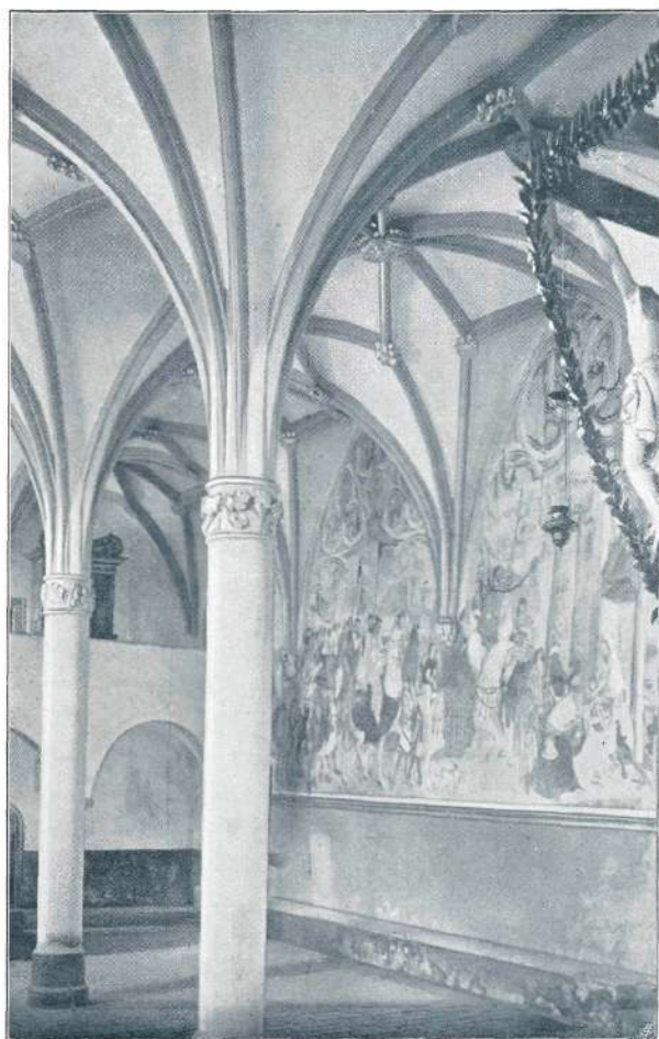
Freske v cerkvi sv. Primoža.

sredi 19. stoletja popolnoma preslikane in, kot se je izkazalo, tudi nekatere reči izpremenjene; tako je slikar n. pr. zakril pri sliki »Marija, pribežališče kristjanov« prsi, ki jih je Marija nudila pribežnikom, s tem, da ji je prekrizal roke na prsih; na podoben način je zakril prsi tudi sv. Elizabeti, ki je došla Marijo. Vsled moče, ki je prišla v cerkev, so nekatere barve popolnoma počrnele, tako da so slike zelo grdo izgledale. Vrednost slik je bila pa posebno v ikonografskem oziru tudi v tem stanju velikanska, saj je druga polovica 16. stoletja v alpskih deželah prav slabo zastopana po slikarskih spomenikih, pravtako Kranjska. Centralna komisija je sklenila zavarovati obstoj tega spomenika. Dala je slike natančno preiskati po slikarju M. Sternénu, ta pa je konstatiral, da je novejša slikarija naslikana v tempera tehniki na staro slikarijo v fresko tehniki in da se dá z lahkoto odmiti. Odmil je vso novejšo slikarijo razen Heroda, ki je bil čisto nanovo naslikan, s tem tudi vse grde črne lise, ki so se nahajale v novejši