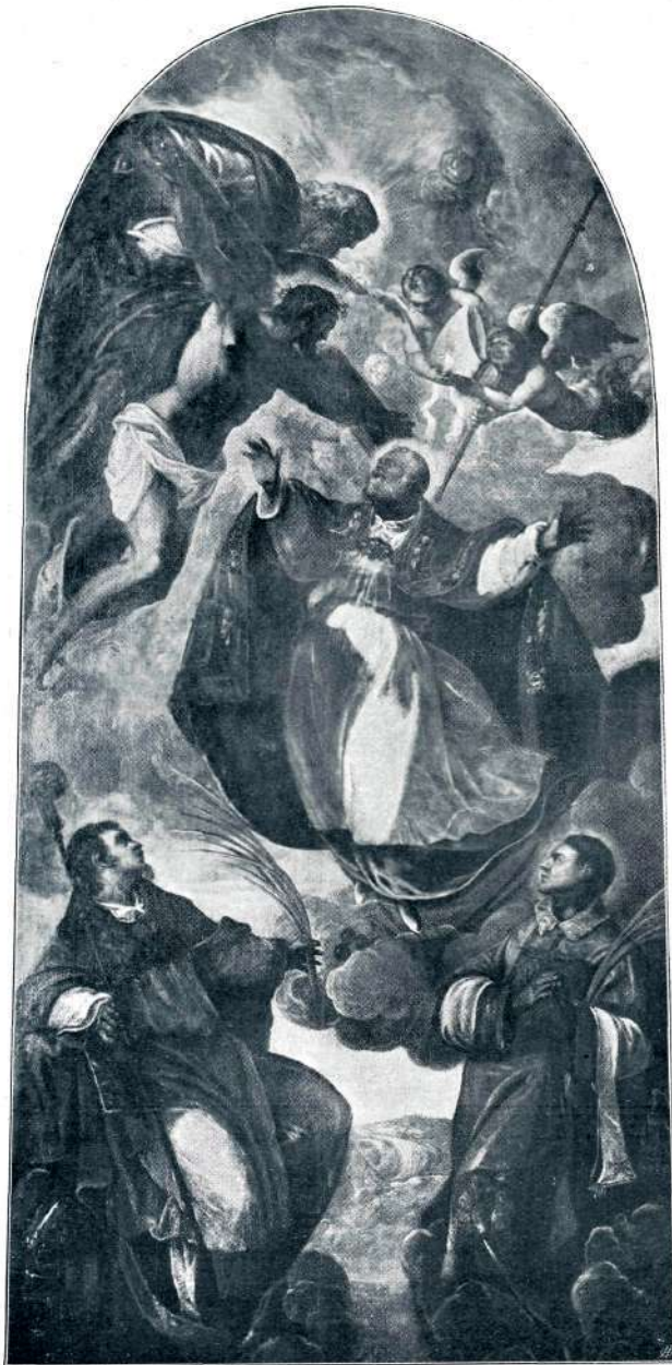
Tintoretto: Sv. Nikolaj.

to se pravi, obstoja le, dokler je v tem ali onem oziru spomenik nepokvarjen in nepotvarjen poročevalec o preteklosti. Zgodovinsko stališče zahteva torej ohranitev tega, kar je na spomeniku še nepokvarjeno, prvotno, takega kot smo mi prejeli;