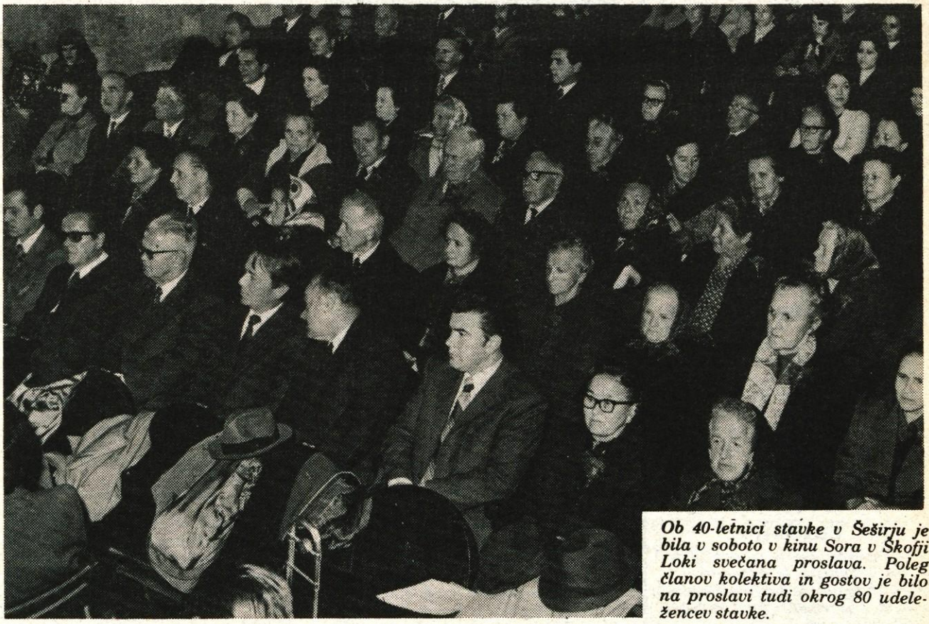
Ob 40-letnici stavke v Šeširju je bila v soboto v kinu Sora v Škofji Loki svečana proslava. Poleg članov kolektiva in gostov je bilo na proslavi tudi okrog 80 udeležencev stavke.

»Vedeli smo, da je leto poslovno uspešno, vendar je delodajalec odklanjal naše zahteve. Mi pa smo vztrajali in ker po preteku določenega roka, to je 11. oktobra 1935, zadeve še niso bile rešene, smo začeli s stavko. Organizacija štrajka se je v celoti posrečila. Proizvodnja se je povsem ustavila. Že takoj prvi dan smo organizirali stavkovni odbor, ki je takoj napravil razpored straž pri vseh vhodih v tovarno. Stražili smo v skupinah in se menjavali vsaki dve uri, noč in dan, ves čas trajanja stavke. Stavka ni presenetila samo delodajalca, ampak je močno odjeknila tudi med delavci v Škofji Loki in drugih gorenjskih mestih. Vse pošteno delavstvo se je z našim bojem strinjalo. Le mestna buržoazija nas je zasmehovala češ, da smo se upijanih kruha in da stavka ni za Škofjo