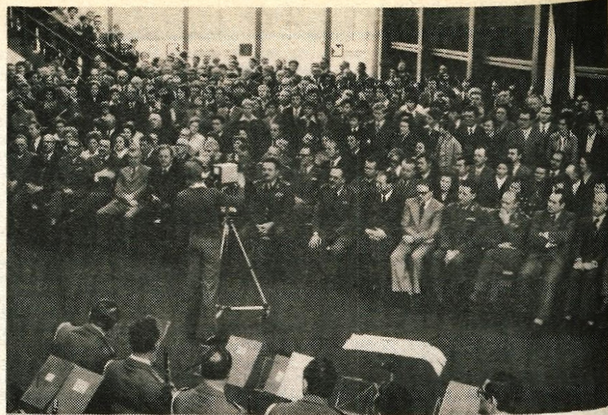
Otvoritev nove vojaške gimnazije »Franc Rozman-Stane« so se udeležili številni gostje.

Besedilo: L. Bogataj