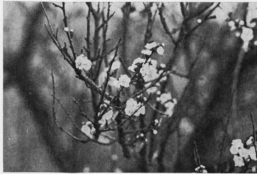
Spomlad je spet tu!

GORICA Travnik, vogal ul. Roma in Oberdan