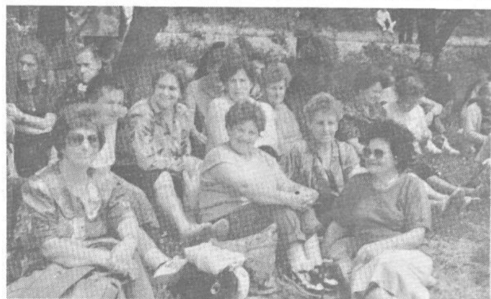
Vrzdenski upokojenci na Komelu nad Pliberkom

Delavci osnovne šole Oskarja Kovačiča, Ljubljana