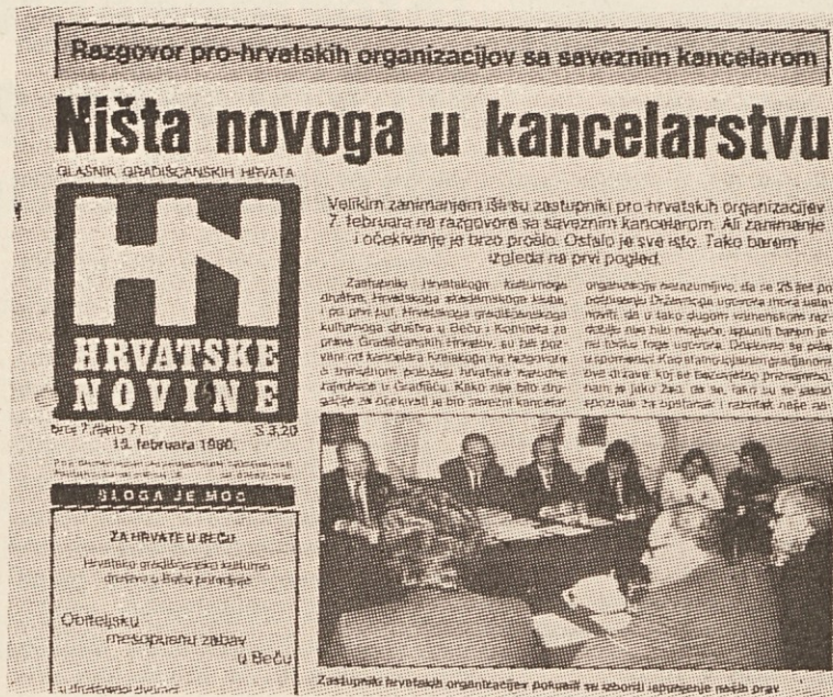
Hrvatske novine — centralno glasilo izhaja tedensko

Denarno vedno v težavah, se je moral pogostokrat boriti za obstoj z zbirkami in darili. De-