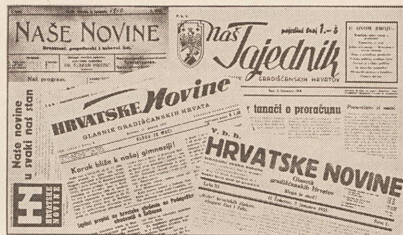
70 let tiska gradiščanskih Hrvatov

glasila, da bi z intenzivnimi reklamnimi akcijami zvišala številni naklade in bralce in da bi se, kar se da, zavarovala tudi denarno, da bi tako še bolje mogla izpolniti nalogo — v boju za ohranitev in razvoj etnične pluralizma v deželi.