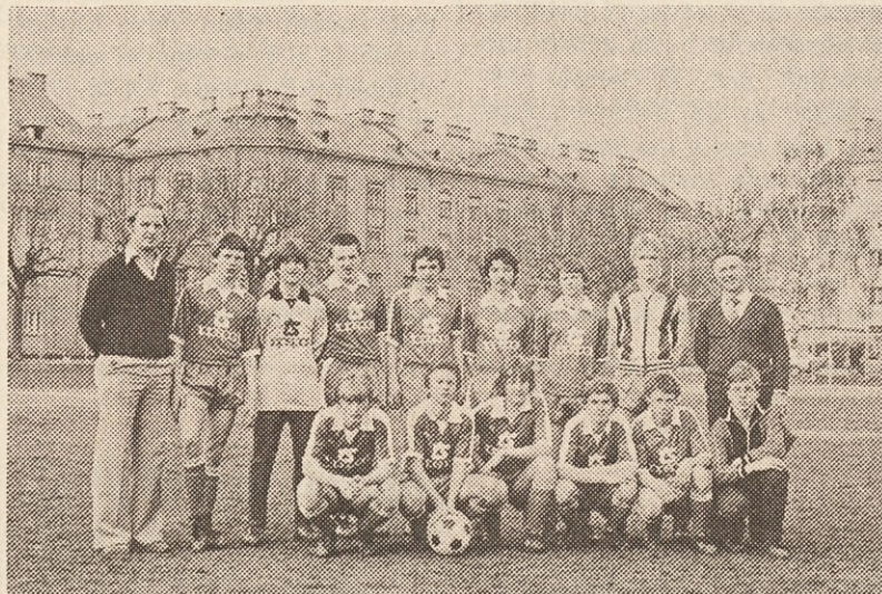
Moštvo mladincev v novih majicah tovarne Topsport