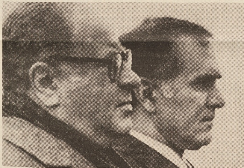
Kreisky in Djuranović v Beogradu: gospodarski, kulturni in socialni razmah manjšin.

žavne pogodbe izvirajoče in druge mednarodnopravne obveznosti. Storila bo vse, da zagotovi obstoj in uspešen razvoj slovenske in hrvaške narodne skupnosti v Avstriji in da za-