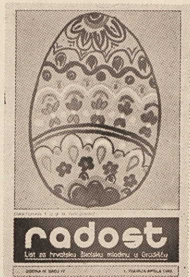
Radost — šolski list izhaja občasno