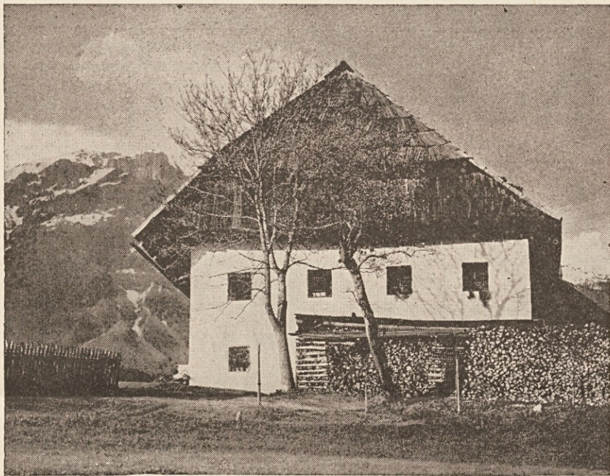
Pomlad na komeljski kmetiji

od njih kakšen sorodnik ali pa znanec. Ker sem tudi jaz to doživel, bom vam ta dogodek najprej zapisal.