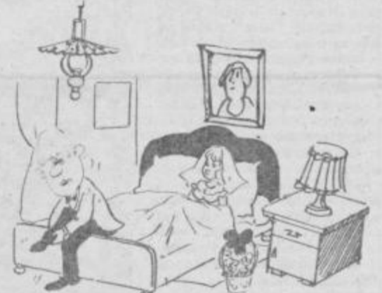
Ko se bom drugič poročil, bom obul bolj razhojene čevlje.