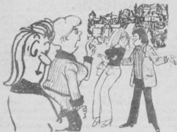
- Nemarneža, kar tu na cesti bi se otipavala! - Gospa ima prav, ljubica, pojediva raje v mojo sobo!