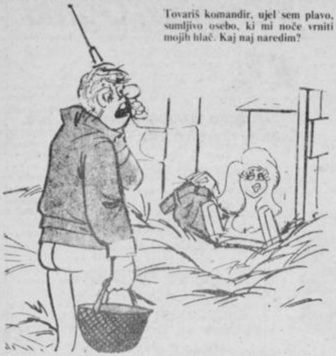
Tovariš komandir, ujel sem plavo, sumljivo osebo, ki mi noče vrniti mojih hlač. Kaj naj naredim?