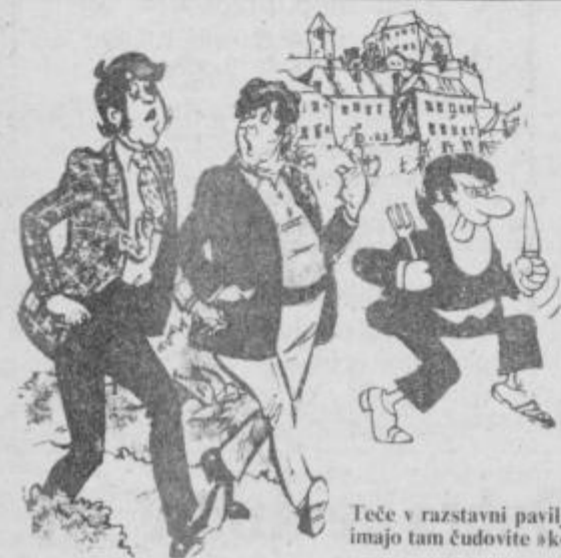
Teče v razstavnih paviljon, pravi, da imajo tam čudovite »kolince« ...