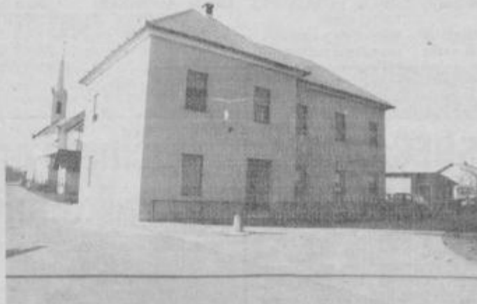
Obnovljen dom upokojencev v Markovcih.

in Primorskem. Letos pa smo v jesenskem času naš dom zunaj obklesli v novo obleko — dobil je novo fasado.