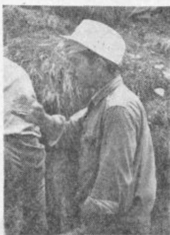
Delo v kamnolomu je bilo naporno, pa vendar so ga vojaki z veseljem opravljali