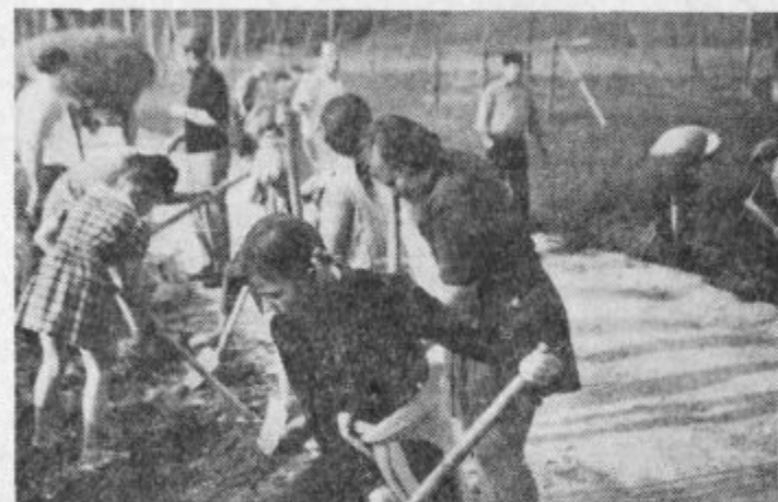
Mladina na prostovoljnem delu na cesti proti Hrastovcu. Do zdaj se je akcije udeležilo že 3.500 Velenjčanov in okoličanov