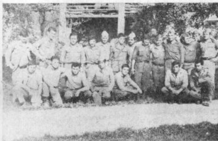
Skupina fantov, vojakov JLA, ki so pomagali v Skalah se je pred odhodom slikala za spomin