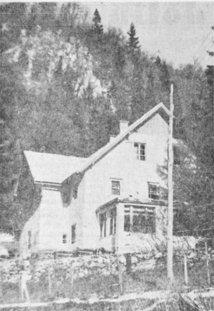
KOČA NA PAŠKEM KOZJAKU