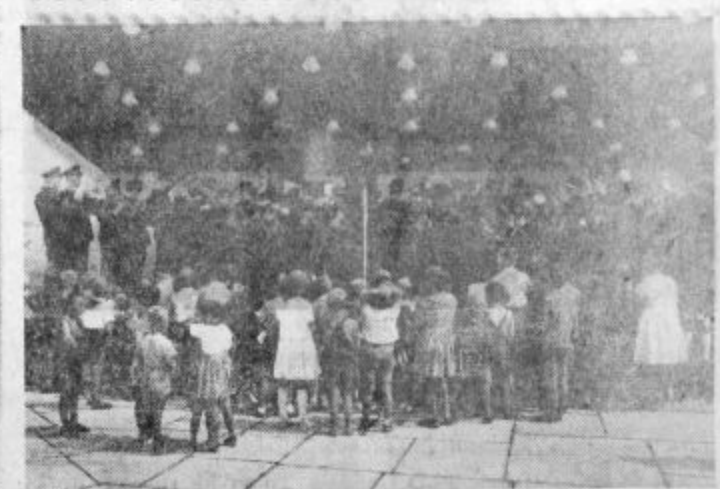
Promenadni koncert v glasbenem paviljonu v velenjskem parku