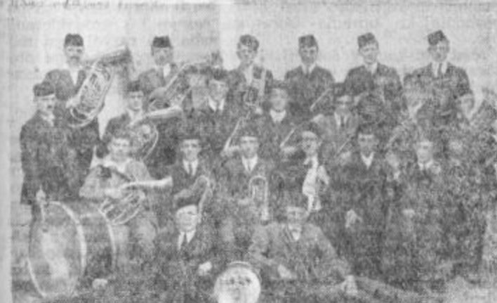
Godbeniki rudarske godbe leta 1924

V splošni bolnišnici Slovenj Gradec računajo, da bo velenjska občinska skupščina pokazala razumevanje do obnove internega oddelka bolnišnice in tudi zagotovila del potrebnih sredstev za odplačilo anuitet.