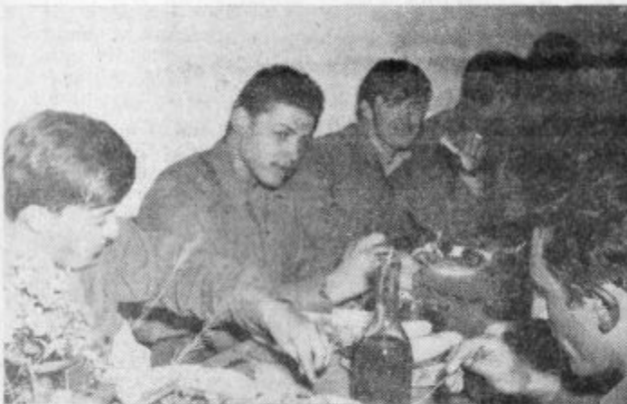
Skalčani pa so jim pred slovesom pripravili sprejem in jih pogostili. Fantje so bili tega zelo veseli