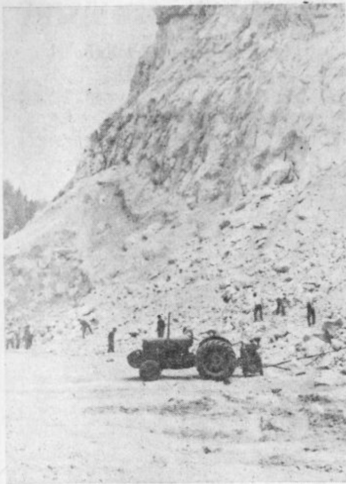
Inženerske enote JLA iz Celja so v preteklih dneh prebivalcem iz Skal, Plešivca in Hrastovca pomagale pri modernizaciji ceste. V Škalskem kamnolomu so razstrelili blizu 7.000 kubikov kamenja