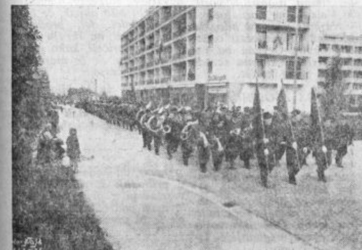
Rudarska godba v spredu po ulicah Velenja

Po osvoboditvi je rudarska godba iz Velenja znova začela svoje kulturno poslanstvo. V velikem razmahu rudnika lignita Velenje je rudarska godba s svojim igranjem bodrila člane rudarskega kolektiva, da so lažje premagovali velike delovne naloge. Godba je bila navzoča, ko so velenjski rudarji zakoličevali novi jašek in tudi kasneje, ko so po tem jašku že izvozili prve tone nakopanega lignita. Rudarska godba pa je bila navzoča tudi takrat, ko so rudarji začeli