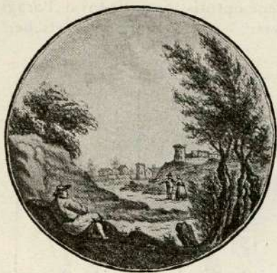
Iz domovine V. (Sličica Barage.)

seca, kjer je dal tiskati indijansko knjigo: Življenje Gospoda Jezusa Kristusa. Potem je šel v Rim in čez Kranjsko na Dunaj. Dne 26. malega travna leta 1837. se je povrnil v Ameriko, a prišel je šele meseca vinotoka k svoji čredi pri sv. Jožefu.