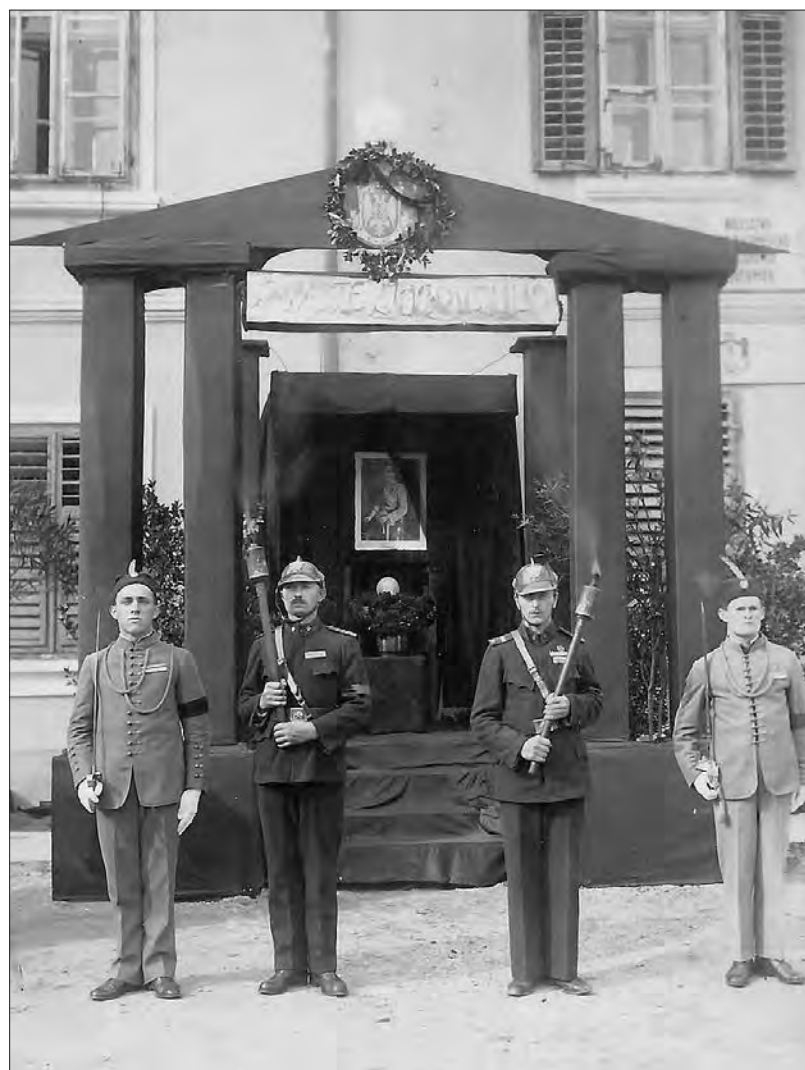
Žalna loža pred ljutomersko Mestno hišo ob smrti kralja Aleksandra leta 1934.