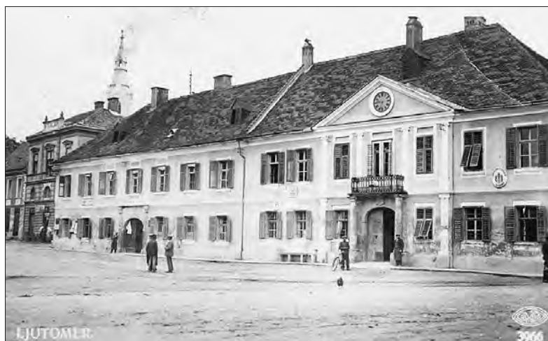
Podoba Mestne hiše v Ljutomeru leta 1939.