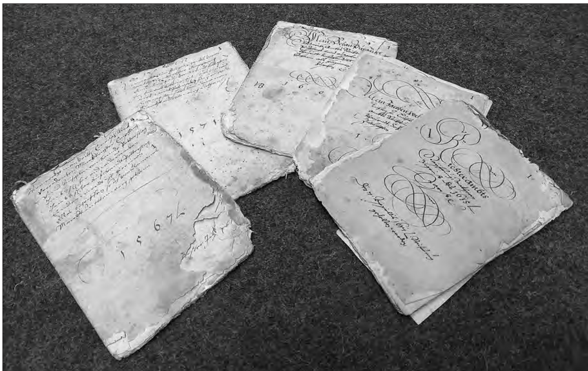
Letni obračuni (1567–1650).