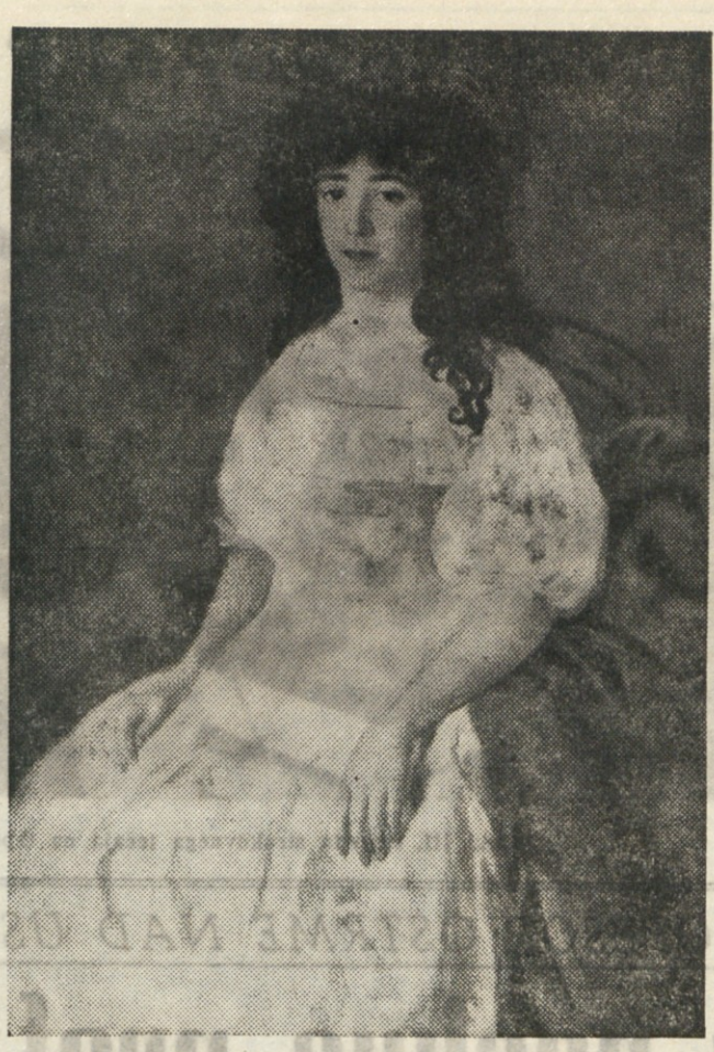
Portret kneginje Florez