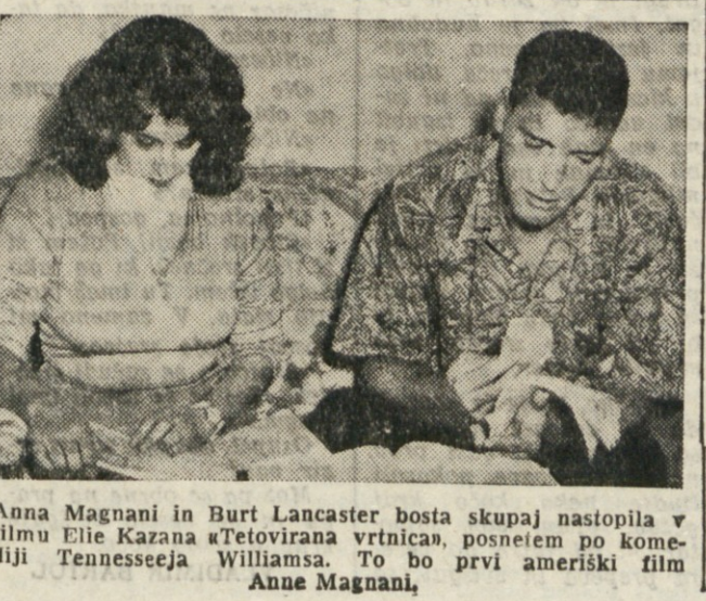
Anna Magnani in Burt Lancaster bosta skupaj nastopila v filmu Elie Kazana «Tetovirana vrtičnica»...