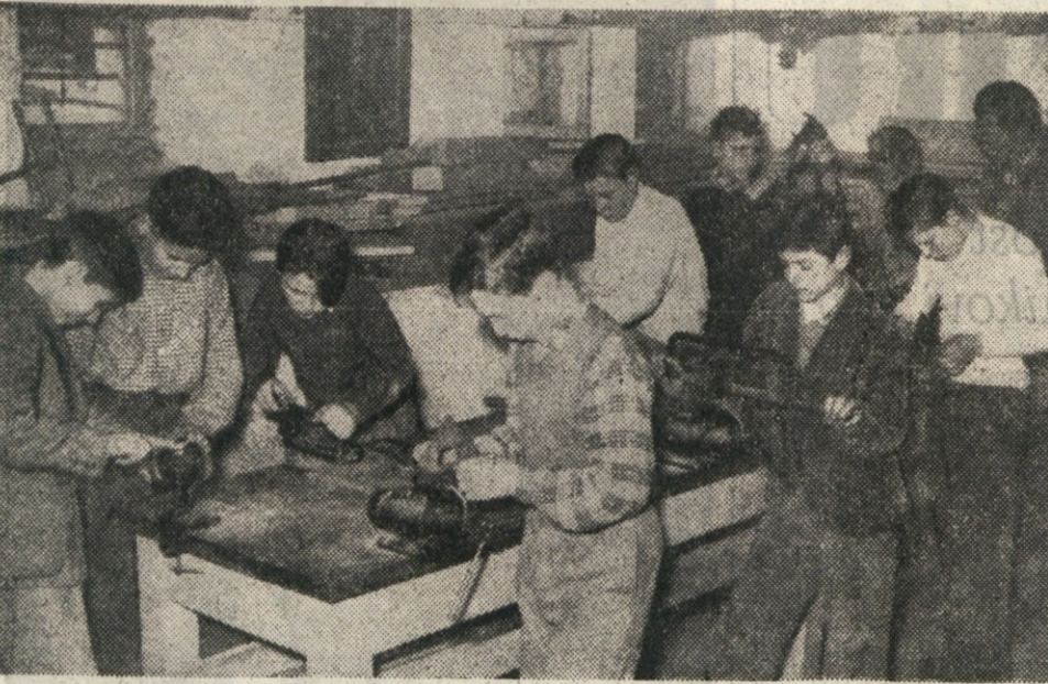
Dijaki III. razreda strokovnega tečaja na Opčinah pri delu