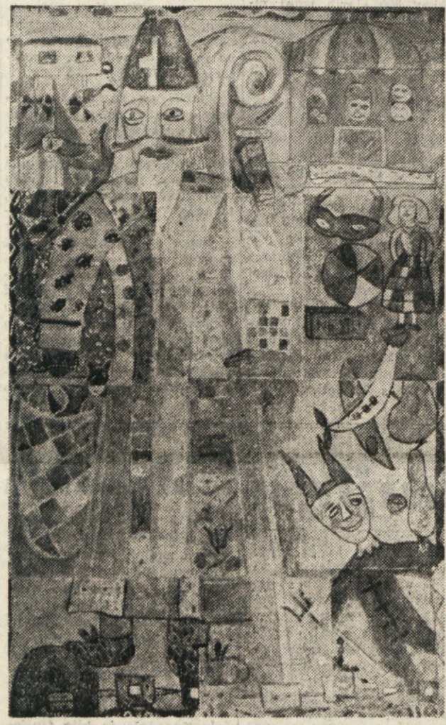
Kolektivna risba, katero so naredile dijakinje Slovenskega državnega učiteljskega v Trstu

Pri tem načinu vsak učenec najprej nariše in nato pobarva le del bodoče skupne slike, pri čemer se sprosti smisel za fantazijo in barve