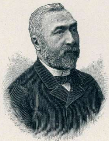
E. Combes, francoski ministrski predsednik.