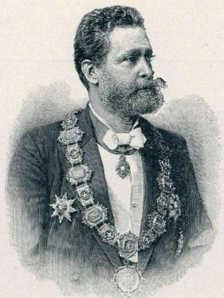
Dr. Karol Lueger, dunajski župan.

Slovansko zborovanje na svetovni razstavi v St. Louisu. S svetovno razstavo v St. Louisu je