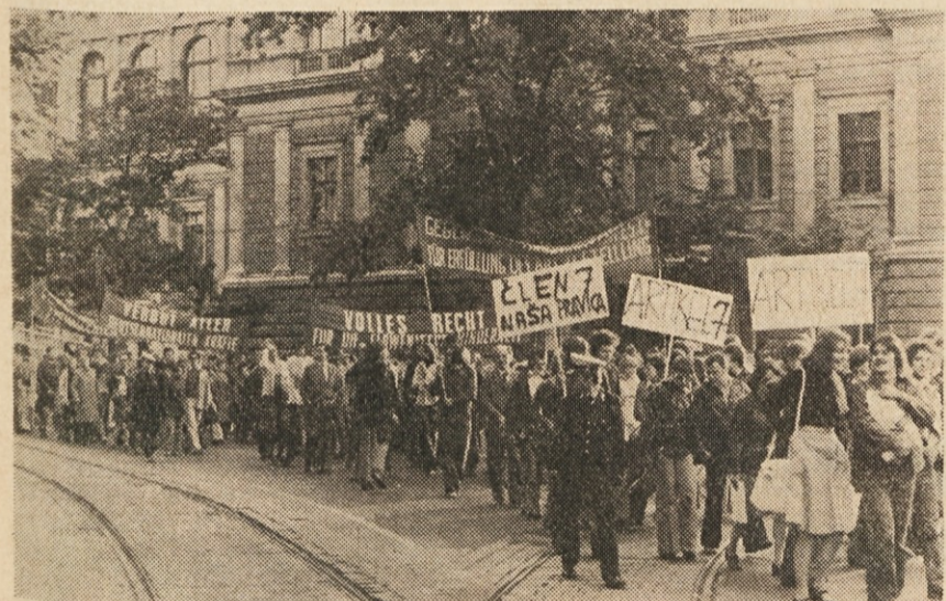
Nad 3000 ljudi je demonstriralo v dolgem sprevodu mimo parlamenta (slika v sredini) in mimo univerze (slika zgoraj) proti vsakemu preštevanju.

cij, ki so se medtem pogovarjali z eksperti v notranjosti, so v sejni sobi odprli okna in mahali demonstrantom v pozdrav. Zanimivo, da je eden od tajnih policajev prihitel v sejno sobo in rotil slovenske zastopnike, naj prenehajo z ma-