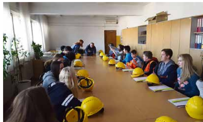
Razgovor o delu livarne in njenem vplivu na okolje

Spoznali so nove prijateljke iz drugih držav in okoliščine, v katerih so se morali sami znajti. Projektna naloga je uspela, prav tako so lepo predstavili našo Slovenijo – tudi s pomočjo risb in ostalih likovnih izdelkov, ki so