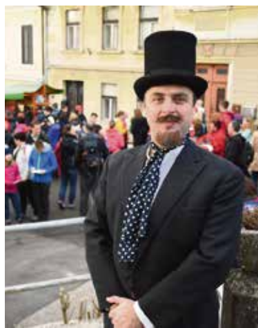
Pohodnike je že v Višnji Gori spremljal lik pisatelja Josipa Jurčiča

Petnajst kilometrov dolga, razgibana in nezahtevna ter s soncem obsijana pot se je začela v Višnji Gori, kjer so pohodnike pozdravljali prijazni domačini in zvoki stiške godbe. Pot jih je najprej vodila mimo Starega gradu grofov Višnjegorskih, kjer so dobrodošlico zanje pripravili člani Kulturnega društva Janez Cigler iz Višnje Gore. Na poti proti Polževem je bil obvezen postanek pri stojnici Turističnega društva Polzevo in Društva podeželskih žena Ivanjščice, nekaj več časa za počitek in okrepitev pred nadaljevanjem poti pa so si pohodniki vzeli pri hotelu Polzevo, kjer so čaj in druge napitke