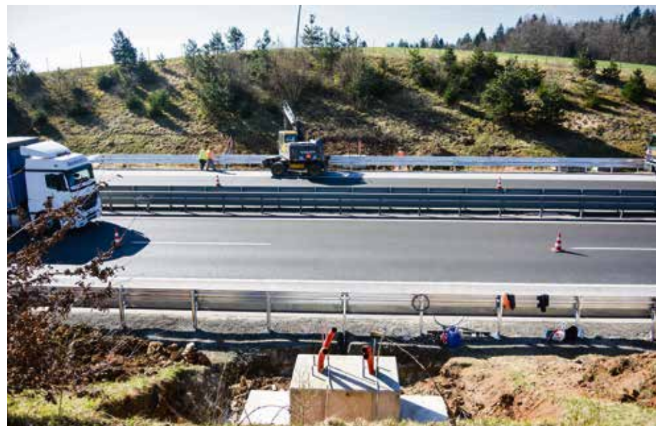
Na območju naše občine se predvidevata nadzorni portal v Ivančni Gorici in cestninski portal pri cestninski postaji Dob.