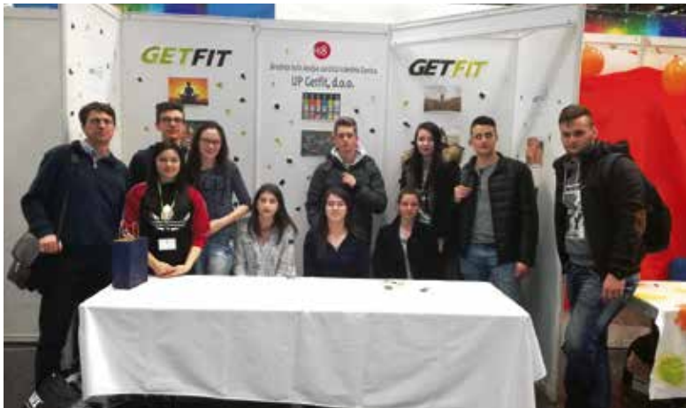
Tik pred odhodom domov

Tako kot že vrsto let dijaki v 3. letniku ustanovijo učno podjetje, v katerem vsak izmed dijakov dela na svojem področju oziroma delovnem mestu. Letos smo dijaki ustanovili učno podjetje z imenom GETFIT, d. o. o. Celo šolsko leto poslujemo z drugimi učnimi podjetji in tudi fizičnimi osebami tako v Sloveniji kot v tujini. Učna podjetja so sicer simulacija pravih podjetij z vsemi potrebnimi oddelki in delovnimi mesti: od direktorja, tajnice, trženja, računovodstva in kadrovske službe. Kar nekaj časa smo poleg rednega poslovanja v letošnjem šolskem letu namenili pripravi na mednarodni sejem v Celju, ki se ga je udeležilo 57 učnih podjetij, od tega je bilo kar 24 tujih (Italija, Avstrija, Romunija, Hrvaška). Na sejmu smo predstavljali svoje učno podjetje in celotno ponudbo, prodajali svoje storitve drugim učnim podjetjem in obiskovalcem ter se udeležili tudi treh poslovnih razgovorov. Poslovali in nakupovali pa smo od drugih učnih podjetij, saj je bila ponudba res