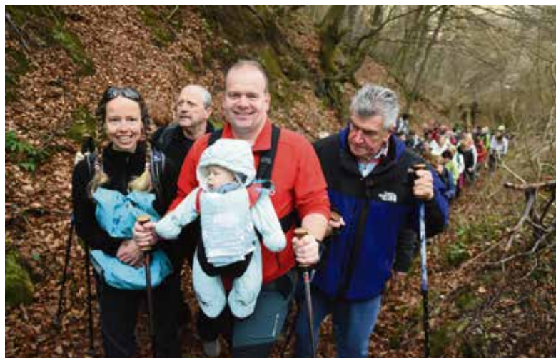
Jurčičeva pot – za vse generacije