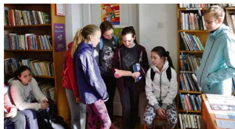
Namige o skritih zakladih stiške kneginje so sedmošolke iskale tudi v knjižnici

Letošnja prvoaprilska sobota bo učencem in učiteljem OŠ Stična ostala v spominu po domišljijemskem potovanju v čas prazgodovine, ko je nad današnjim Virom pri Stični cvetelo Virsko mesto, pred skoraj tremi tisočletji pomembno halštatsko kulturno in trgovsko središče Dolenjske.