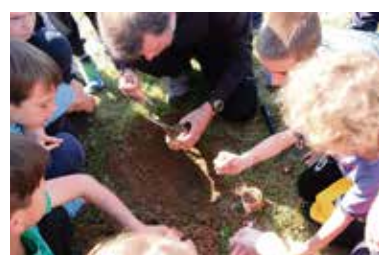
Dragocene zapestnice in keramične posodice so iznajdljivi pustolovci našli zakopane v tleh