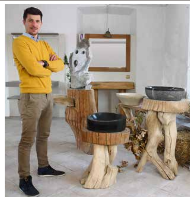
Želja in vizija podjetja Meduzza je združitev umetnostne obrti na področju lesa, kovine in kamna