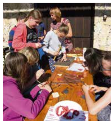
Dekleta izdelujejo replike zapestnic in ogrlic, ki so jih kot pridanke našli arheologi v kneginjinem grobu v gomili št. 48