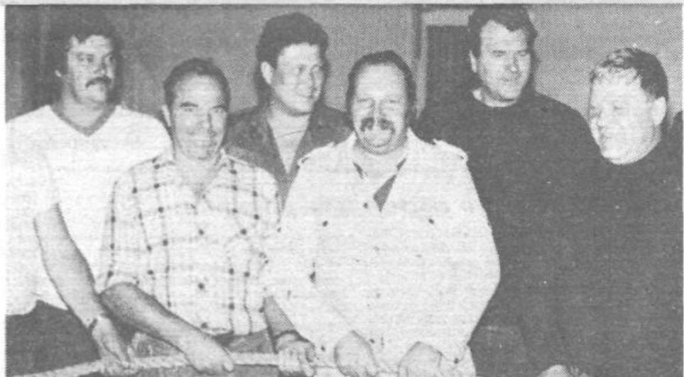
Nepremagljiva ekipa vrvašev, ki nastopa tudi za obrtno združenje Ljubljana Vič-Rudnik