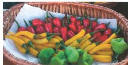
Fotografije iz brošure, lokalni ponudniki Svetega Tomaža

Septembra smo pričeli z izvajanjem aktivnosti v sklopu projekta Povezovanje inovativnega partnerstva Destinacije Jeruzalem Slovenija . Občina Sveti Tomaž bo izvedla aktivnosti promocije, in sicer izdelavo platnenih vrečk, zakup prostora za jumbo plakat in izdelavo zemljevida s trganko. Z aktivnostmi v projektu bomo prispevali k prepoznavnosti in promociji občine in celotne Destinacije Jeruzalem Slovenija.