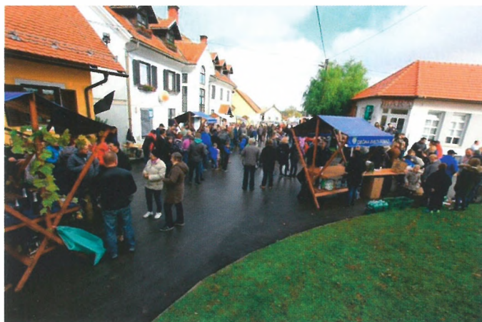
Martinovanje 2019, čas pred corono, ko smo še lahko praznovali skupaj

Tudi v Turističnem društvu se trudimo, da nam ta korona čas ne bi preveč omejil delovanja. Žal smo v zadnjih dveh letih vseeno bili primorani aktivnosti društva izvajati v omejenem obsegu. Že drugo leto zapored smo morali odpovedati večje prireditve, kot so Martinovanje in Fašenk po Tomaževsko ter ocenjevanje postržjač. Vseeno smo izvedli postavitve klopotca, vendar v zelo okrnjeni obliki. Upamo in želimo si, da bo naslednje leto prineslo več pozitivnega, da bomo lahko ponovno skupaj preživljali in doživljali družabne trenutke veselja in dobre volje. Hkrati vas vabimo, da se nam pridružite v naše vrste kot član/ica društva. Ob prihajajočih praznikih vam želimo vse dobro.