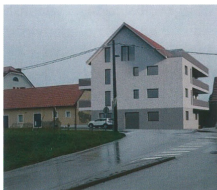
Foto: predviden objekt iz idejne zasnove

Že nekaj časa si prizadevamo za izgradnjo poslovno stanovanjskega objekta v centru Svetega Tomaža. V ta namen je bila izdelana idejna zasnova tega objekta, v sklopu