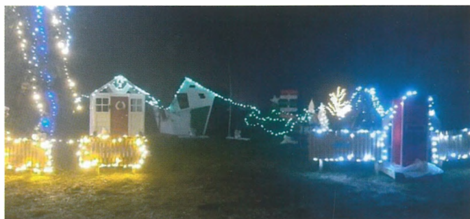
Foto: Pravljična dežela v centru Svetega Tomaža

V letu 2020 nam čas ni bil najbolj naklonjen. Zašli smo v čas, ko smo še bolj potrebovali drug drugega kot običajno. Ni bilo potrebe po materialnih dobrinah, veliko nam je pomenil nasmeh, stisk roke in topla beseda. Da pa smo pričarali nasmeha na obraze tistih, za katere društvo deluje, pa smo se morali še posebej potruditi. Ker nismo izvedli nobenih delavnic, smo vseeno ohranili tradicijo, in sicer božični prižig lučk in božička. Prižig lučk smo izvedli preko Facebooka, natančneje preko spletne strani Društva prijateljev mladine Sveti Tomaž. Virtualno nas je spremljalo nekaj sto ljudi, kar je za nas bil dosežek. Prvič smo tako speljali dogodek in nanj smo zelo ponosni. Župan je imel govor, lučke so se prižgale in pokazali smo našo pravljичno deželo. Seveda je ostala na mestu in so si jo kasneje obiskovalci individualno lahko pogledali tudi v živo. Nekaj dni pred božičem pa smo v sodelovanju z Občino Sveti Tomaž in gasilci PGD Trnovci in PGD Pršetinci na domu razveselili otroke. Dva kombija sta imela traso in obiskala naše najmlajše pred hišo in jim izročila darilo. Tisto pristno veselje, ki so ga otroci pokazali, nas vedno znova žene naprej, da se trudimo in vsako leto pričaramo čar praznikov. Še enkrat hvala za podporo in prostovoljno izrabljeno popoldne, za majhne nasmehke. Odločili smo se postaviti tudi knjigobeznico. Zaradi vseh kovid razmer pa je njena