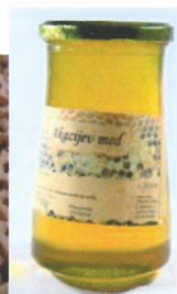
Fotografije izdelkov, lokalni ponudniki Svetega Tomaža