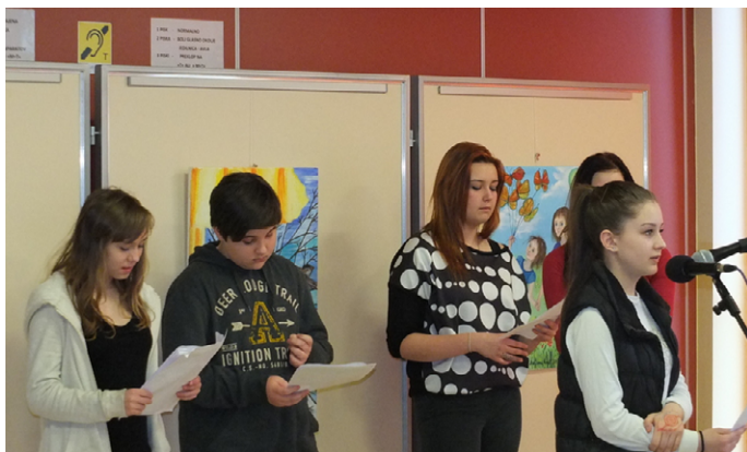
NASTOP V DOMU STAREJŠIH V GORNJI RADGONI