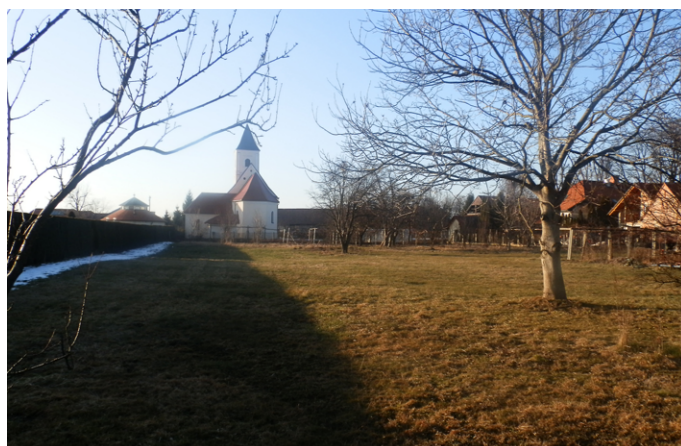
NA TEM MESTU BO UREJENO NOVO PARKIRIŠČE ZA 62 OSEBNIH VOZIL.

Občina Veržej je že izvedla javno naročilo za izbor najugodnejšega izvajalca gradbenih del, a ker odločitev o izboru v trenutku pisanja tega članka še ni pravnomočna, vam še ne moremo sporočiti, kateri izvajalec bo izvajal gradbena dela. Vrednost gradbenih del znaša okrog 160 tisoč evrov, dela pa bi naj bila zaključena do 15. maja 2015.