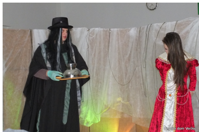
Vzgojni dom Veržej