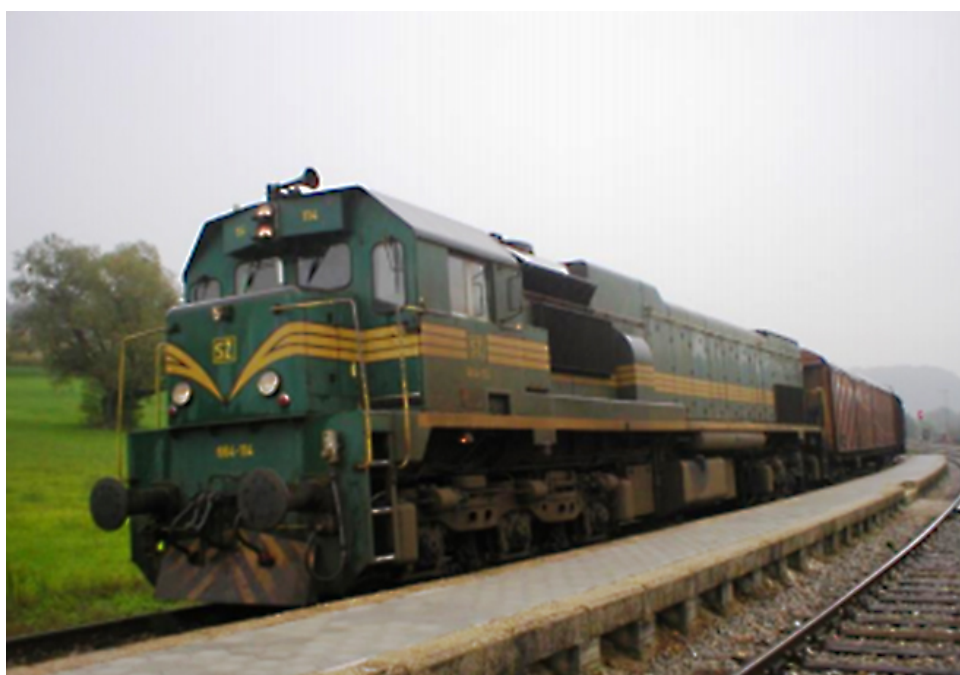
Lokomotiva serije SŽ 664-xxx