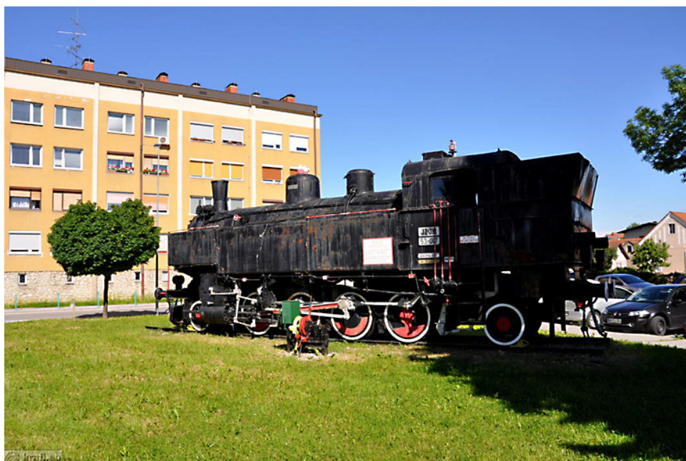
Stara lokomotiva v Murski Soboti