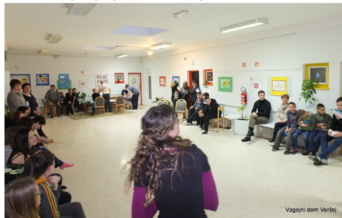
Vzgojni dom Veržej