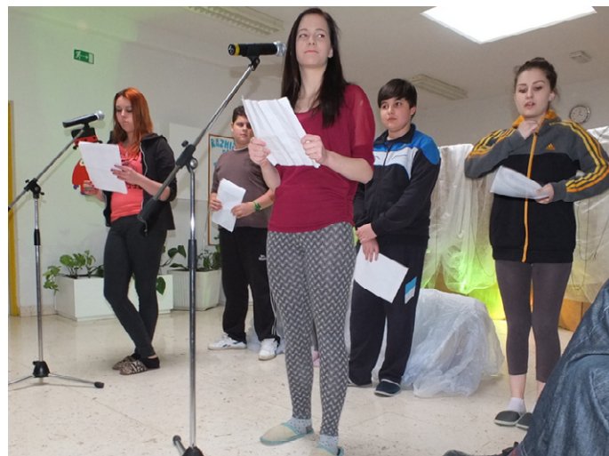
PRIREDITEV OB KULTURNEM PRAZNIKU