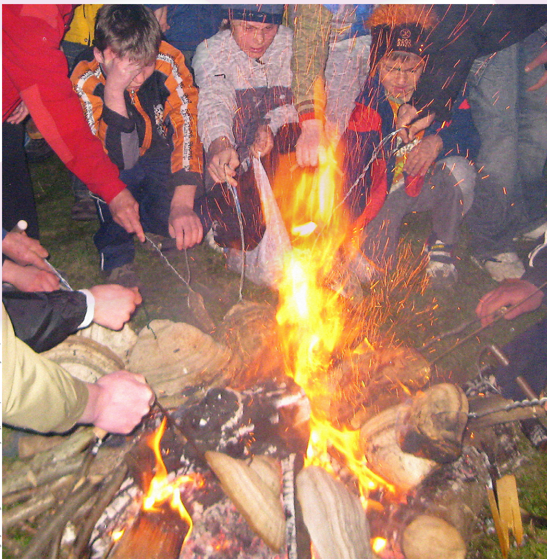
Pržižiganje lesnih gob na veliko soboto zjutraj, Šentupert na Dolenjskem, 2010.

od 27. marca do 2. maja v Puščenjakovi dvorani Centra DUO Veržej