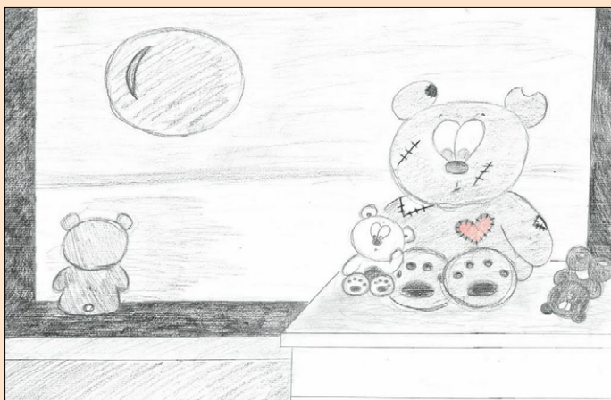
PIA L.: PRIJATELJI

Če vprašate mene, sem se marsičesa naučila in zato tudi izbiram drugače kot marsikdo drug. Skozi zadnji dve leti, ko sem imela precej problemov doma, v šoli, na policiji, v klubu, sem videla, kdo so bili tisti pravi kolegi. Imela sem precej različnih prijateljev, ki sem jih delila v različne kroge npr.: