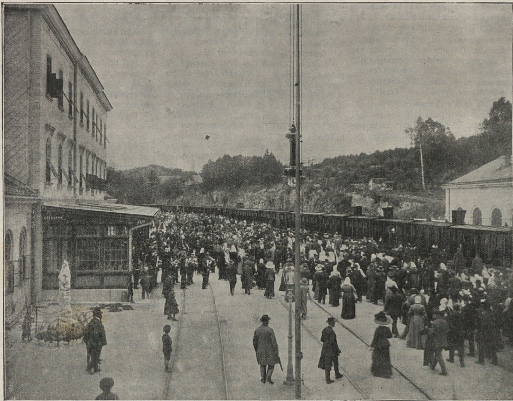
PRIHOD IZLETNIKOV S POSEBNIM VLAKOM.

Prvi udeleženci so došli ta dan že zgodaj zjutraj v Postojno. Tovariši iz Goriške in Primorja so se pripeljali tja z dopoldanskim brzovlakom. Bilo jih je do 100. Na kolodvoru jih je pričakoval in pozdravil v imenu zveze