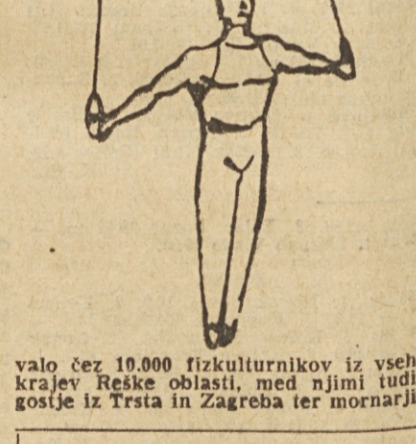
valo čez 10.000 fizikulturnikov iz vseh krajev Reške oblasti, med njimi tudi gostje iz Trsta in Zagreba ter mornarji

REKA. Na stadionu »3 Maje na Kontridi je održan oblajni zlet Bratisva in Enotnosti, največja fizikulturna manifestacija po osvoboditvi v tem delu naše domovine. V mimoohdu je sodelo-