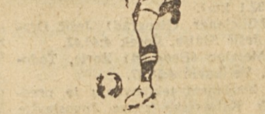
ših in Drventi sedem tekem je »Sarajevo« dobilo, a osmo — v Drventi — je odigralo s »Tekstilcem« neodločeno 0:0.

Sarajevo, Prvak II Zvezne lige »Sarajevo« je končal veliko turnejo po industrijskih centrih Bosne. V tekni 14 dni je moštvo »Sarajevo« odigralo 8 tekem v Dobuju, Kreki, Zivinici, Banovcih, Tuzli, Lukavcih, Zavidovci.