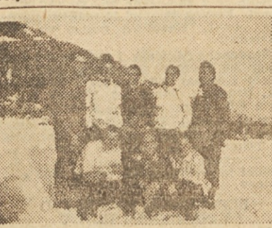
Smučarji iz Litostroja

Dobri delavci — dobri športniki Skoraj dve noč so zrastle nove bele stavbe na Sisenskih poljih, ki dajejo sliko moči in življenjske sposobnosti našega ljudstva. Tisoči delovnih ljudi so pomagali s prostovoljnimi delom in travniki in vrtovi so se spremenili v največje kovinarske podjetje naše prve petletke. Vzporedno z razvojem podjetja se je razvijala in krepila fizikulturna organizacija. Sindikalno športno društvo Litostroji je danes med najboljšimi v naši republici.