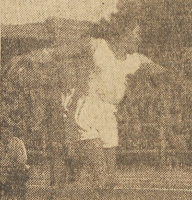
Consolini svetovni rekorder v metu diska

»Osijek, v prijateljski nogometni tekmi je Proleter iz Osijeka zaslužen zmagal nad Slugo iz Novoga Sada z 3:1 (2:1). Sarajevo, V Sarajevu je končan mladinski sampljonat Bosne in Hercegovine v letu 1949. Sodelovalo je 14 mladitv iz šestih Zvezovalca prvenstva sta Kovac (Dobro) in Dučić (Sarajevo) vsak po 9/2 točke.