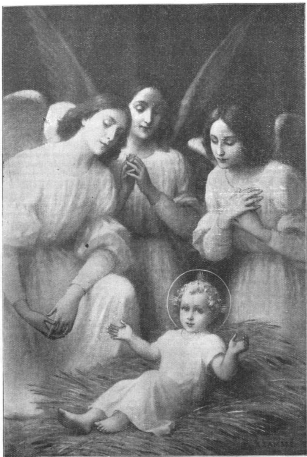
Kristus nam je rojen; pridite molimo ga!