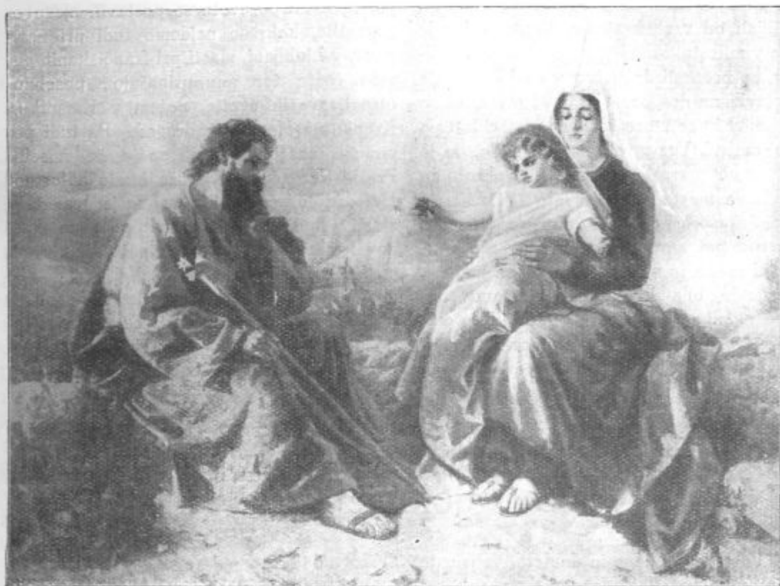
Sv. družina na begu — zgleď našim beguncem ...

Vsa samostanska okolica je bila opuščena, dočim samostan ni trpel nikake škode; nasprotno. Celo najvišji vojaški dostojanstveniki švedski so obiskovali čudežno Dete ter ga obdarovali. V nastopnem letu je pomagal Jezusček zoper kužo ter dodelil karmelitom, da so sprebrnili mnogo protestantov. Kakor nikdo ni zastonj častil božjega Deteta, tako tudi ni nihče odšel kazni, kdor je razžalil milostno Dete. O tem nam poročajo zapiski pre mnogo slučajev. — L. 1655. so slovesno