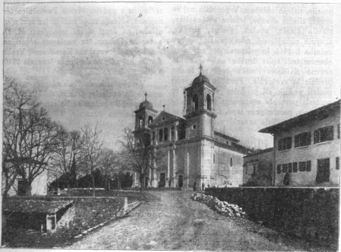
Mirenski Grad — pred cerkvijo.