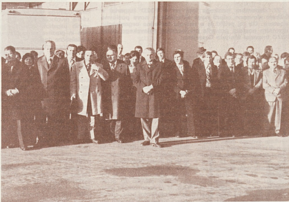
Gosti v Krškem

Za dosegajo zadržanih ciljev pa bomo morali združiti skupne sile, da bi se naša TOZD vnaprej razvijala v skladu s programom, da bi se dogradile do