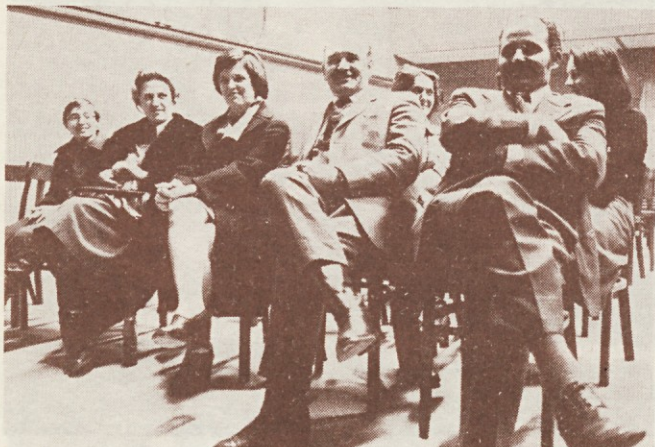
Kviz je bil zabaven

Sindikalne organizacije so prispevale za vsakega otroka 10.000 S din. Seveda, vsi verjetno niso bili najbolj zadovoljni (predvsem starši!) in najbrž bi bilo to in ono pri organizaciji lahko boljše. Sicer pa vseh želja vsem niti dedek Mrz ne more izpolniti.