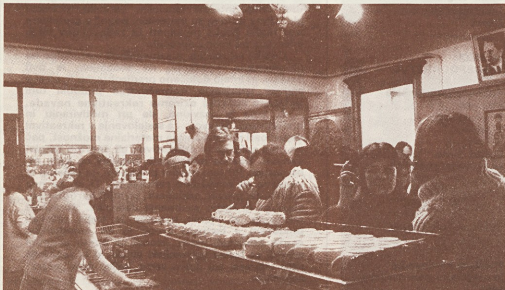
Naš bife v Gradišču