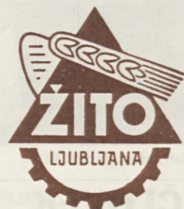
Trgovina v Gradišču

Prepričani smo, da se bo z dobro voljo in discipliniranim delom nas vseh v letošnjem letu marsikaj izboljšalo.