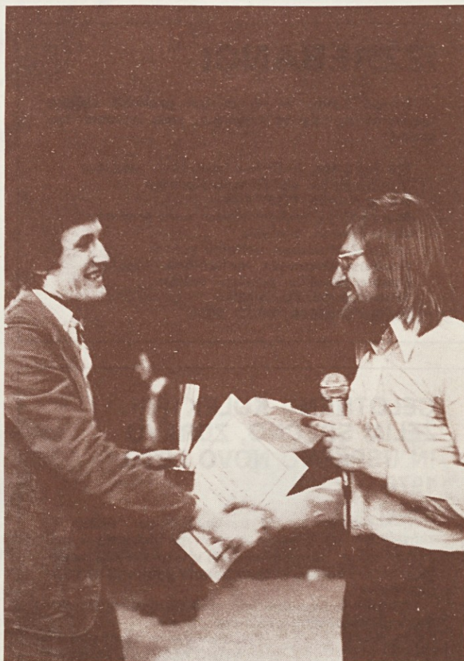
Čestitamo za 1. mestol