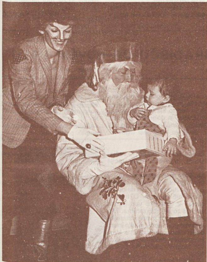
Dobri, stari dedek Mraz

Na zastavljeno vprašanje, pereče v naši TOZD Mlini (pa ne samo tu!), kako zagotoviti udeležbo delavcev na zborih, hkrati tudi odgovarjam: Prisotnost delavcev samoupravljalcev na zborih delavcev in na sejah samoupravnih organov, je ne samo ustavna pravica, temveč tudi in predvsem dolžnost!