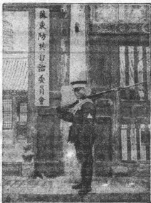
Novi režim na severnem Kitajskem. Slika je posneta v glavnem stanu kitajskih avtonomistov,

je nenadoma postavljena pred usodno odločitev. Prevelika zmaga Italije bi ji ne bila ljuba, prav tako ji pa tudi ni všeč premočna udarna sila