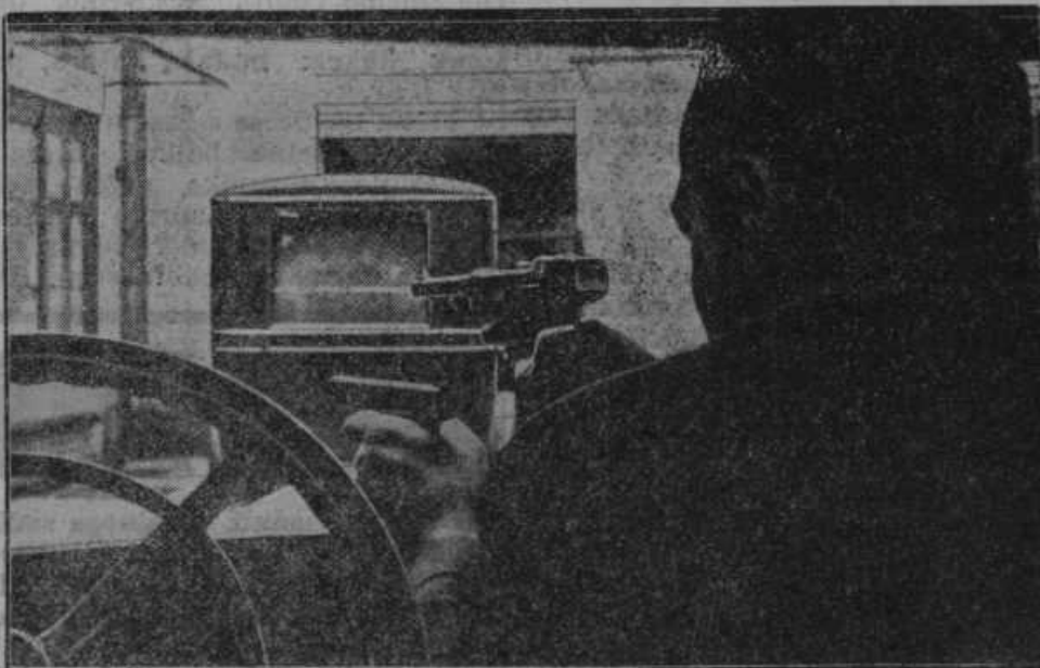
Obramba pri prevozu denarja. Ker napadajo velikomestni tolovaji najrajši prevoze denarja, se vozi za oklopnim avtomobilom, v katerem je denar, — osebni avto. V osebni avtomobilu so uradniki s pripravljenimi samokresi za slučaj napada.