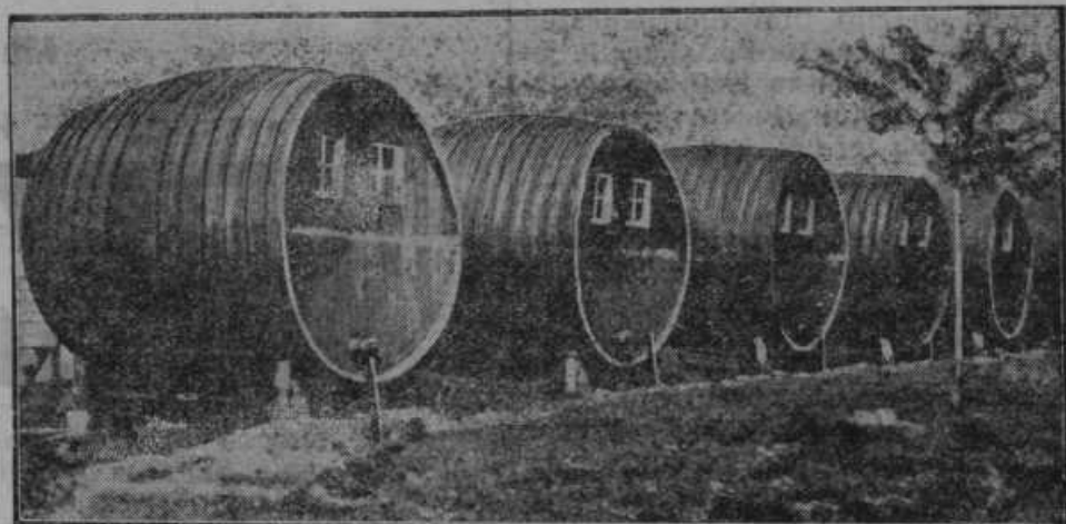
Pri mestu Vermillion v severnoameriški državi Ohio so kupili revnejši ljudje stare sode, v katerih so se nastanili po vzgledu starogrškega modrijana Diogena.