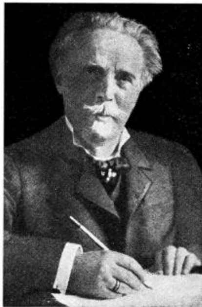
● Znameniti romanopisec Karl May