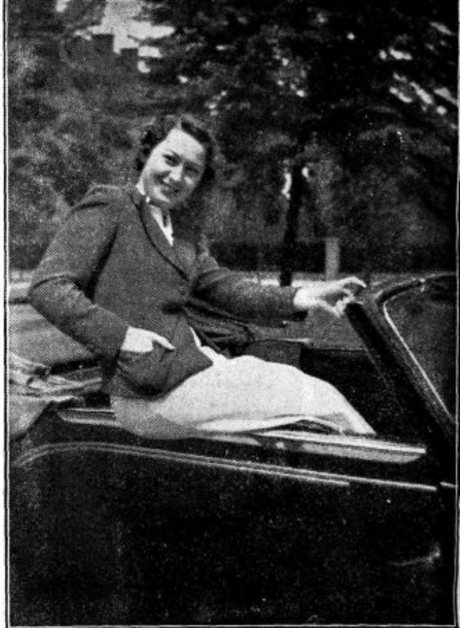
● Filmska igralka Heli Finkenzeller

Pred kratkim so v New Yorku predvajali film o verskem preganjanju kristjanov v Nemčiji pod gornjim naslovom. Film predstavlja hude obtožbe sedanjega nemškega režima. Zaradi tega filmskega dela je bilo nemško časopisje zelo ogorčeno in ga spravlja v zvezo s tako zvanim protidržavnim stališčem nemških cerkvenih krogov. Film so predvajali v Rockefellerjevi cerkvi v New Yorku. Pred predstavo je s prižnice imela govor proti narodnemu socializmu Erika Mann, hčerka velikega nemškega pisatelja Thomasa Manna, ki je pred kratkim izgubil nemško državljanstvo.