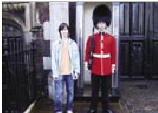
Slikal sem se tudi s častnim stražarjem

tudi z nadstropnimi avtobusi. Na srečo smo imeli lepo vreme od začetka do konca. Veliko-