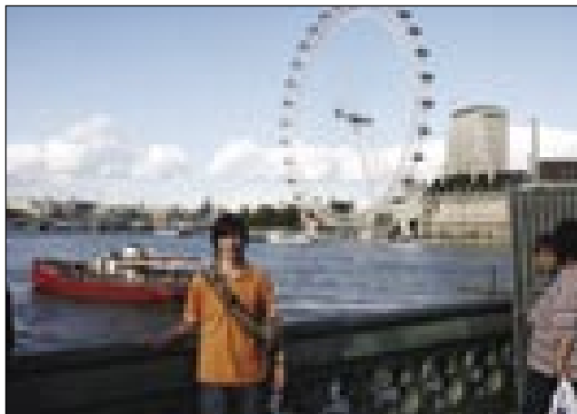
Ogromno kolo se imenuje »London Eye«

čudovitih krajih, vseh jih niti ni mogoče naštet. V Londonu smo se vozili tudi s tamkajšnjimi metroji, z vlakom, pa seveda