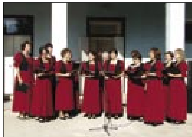
Nemške pevke z Dolnjega Senika

vizijo, računalnike. Vaški dom je bijo obnovljeni s pomočjo Ministrstva za nacionalno kulturno dediščino. Samouprava