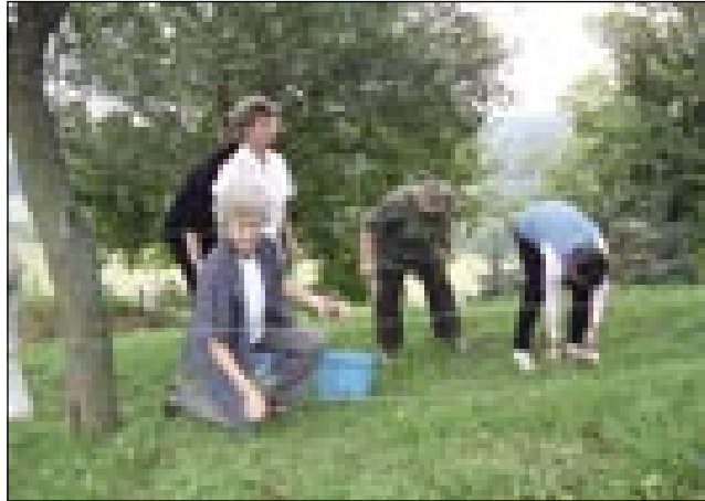
Ženske so flajсно vküppolovile slive, globaunce so pa že prejšnji den sküjale

Že sedem lejt, ka so v Števanovci ustanovili Društvo za lepšo ves. Od tistoga mau se je kulturno življenje vesí vcejlak vömenilo. Društvo je začno