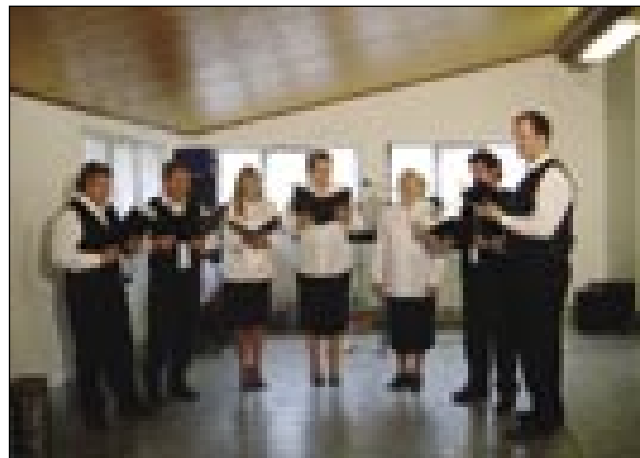
V programi so spejvali senički pevci

njim za tisti čas prejk pisti gazdijo, ranč tak vertinjo za pripravlanje gesti. Vö so mogli zvedeti, sto ma ške potrebne škeri pa v pausado sprostiti. Ka vse so že vözbrodili? Žetvo so delali, mlatili ške s cepami tü, kosili, senau ravnali, ku-