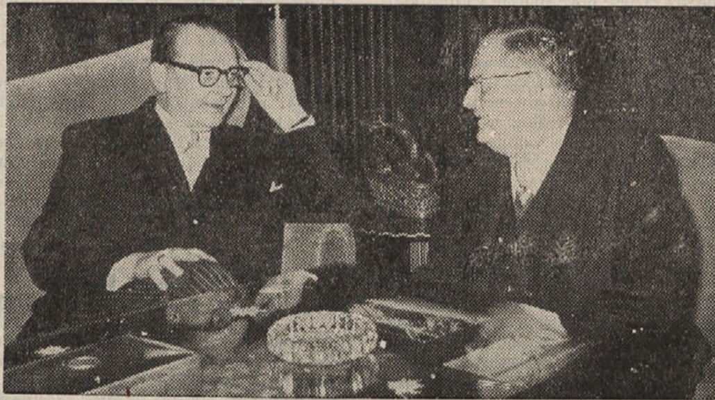
Na nedavnem obisku na Dunaju je zapadnonemški zunanji minister von Brentano imel razgovore s kanclerjem ing. Raabom.

in to dokazuje s kopico statistik in z zamotanimi statistikami. Vendar vse to govorjenje nič ne pomaga, kajti ljudje so na podlagi lastnih izkušenj prišli do prepričanja,