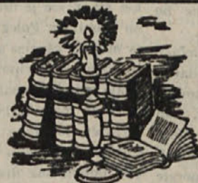
Figure za jaslvice, okraski za božično drevesce. Knjige za Božič v bogati izbiri. Seznam knjig (katalog) lahko dobite na željo brezplačno.