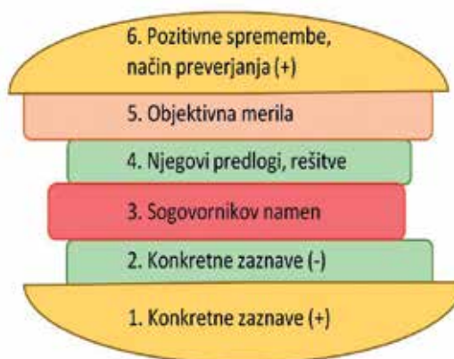
Slika 3: Primer za povratno informacijo z elementi, ki naj bi jih podali s povratno informacijo.

Prirejeno po: https://www.google.si/search?q=povratna+informacija&source=Inms&tbm=isch&sa=X&ved=0ahUKEwIlgPqXk8rTAhUNLIAKHUjAJwQ_AUIBigB&biw=1366&bih=604#imgrc=bSixm88-hjqUtM (9. 1. 2017).