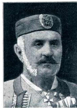
ČRNOGORSKI KNJAZ NIKOLA