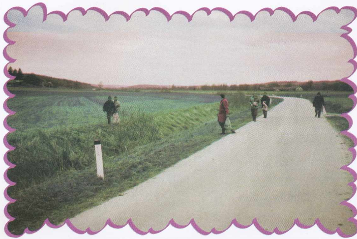
Spomladanska očiščevalna akcija Tavaszi környezetrendezési akció