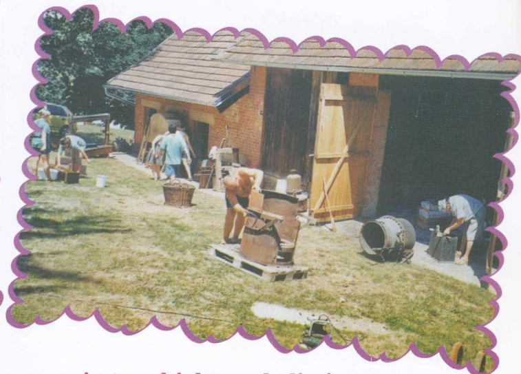
Urejanje notranjosti Etnografskega muzeja ter objektov okoli njega A kapornaki Néprajzi gyűjteménynek helyet adó Skerlák féle ház belsejének és melléképületeinek karbantartási munkálatai