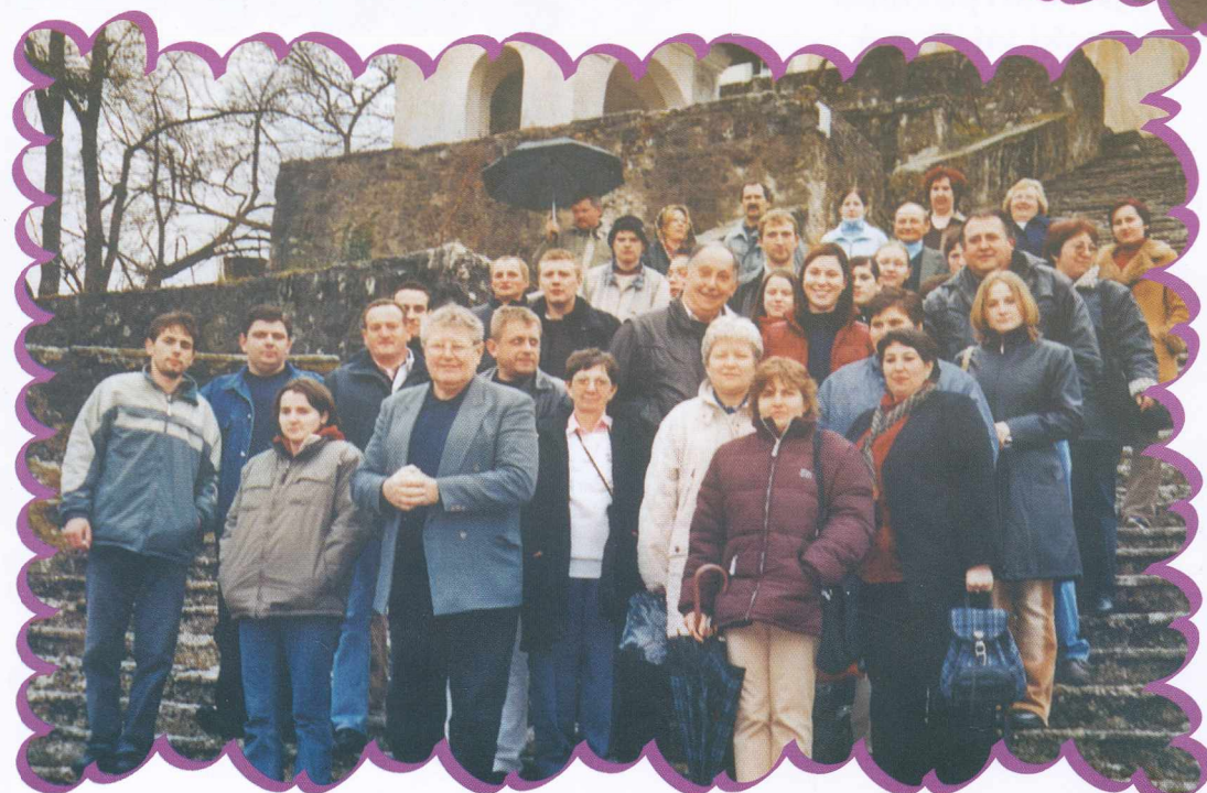
Udeleženci izleta na Gorenjsko A gorenjskoi kirándulás résztevői