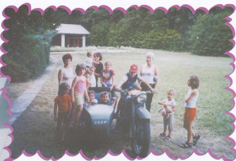
Slovo naših mini maturantov od vrta A kis érettségizők búcsúja az óvodától