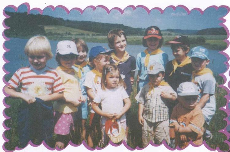
Ob jezeru je lepo Jaj, de szép a tóparton!