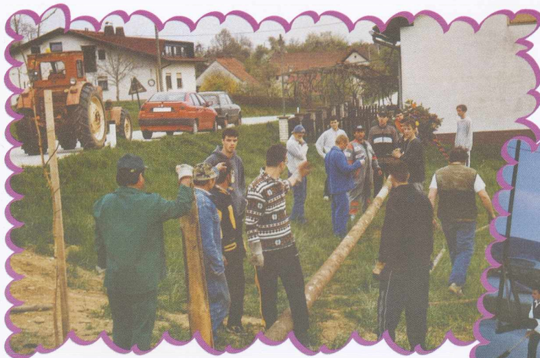
Postavljanje in podiranje mlaja Májusfa állítás és kitáncolás