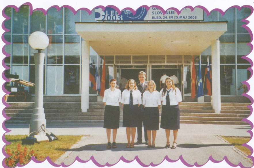
Naši udeleženci 14. kongresa Gasilske zveze Slovenije na Bledu A Szlovén Tűzoltó Szövetség 14. kongrezusán résztevő küldöttségünk