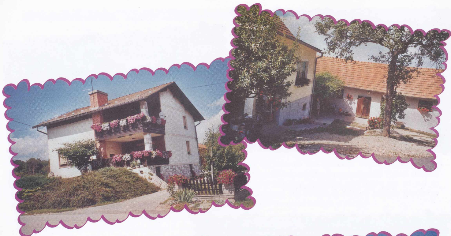
Slike dobitnikov priznanj za najlepše urejeno domačijo oziroma rože Az idei év díjazott lakóháza és virágai