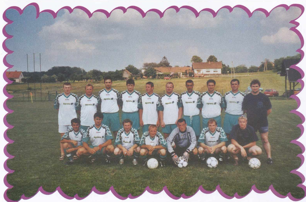
Članska ekipa NK Hodoš A hodosi LK felnőtt csapata