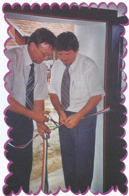
Srečanje na Krplivniku Kapornaki találkozó