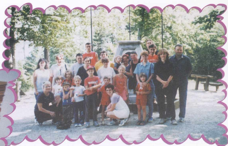
Počitek na Tromeji Pihenő a Hármashatáron