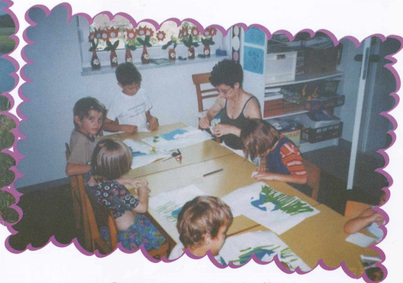
Gubamo labode in žabice Készülnek a hattyuk, békák,...