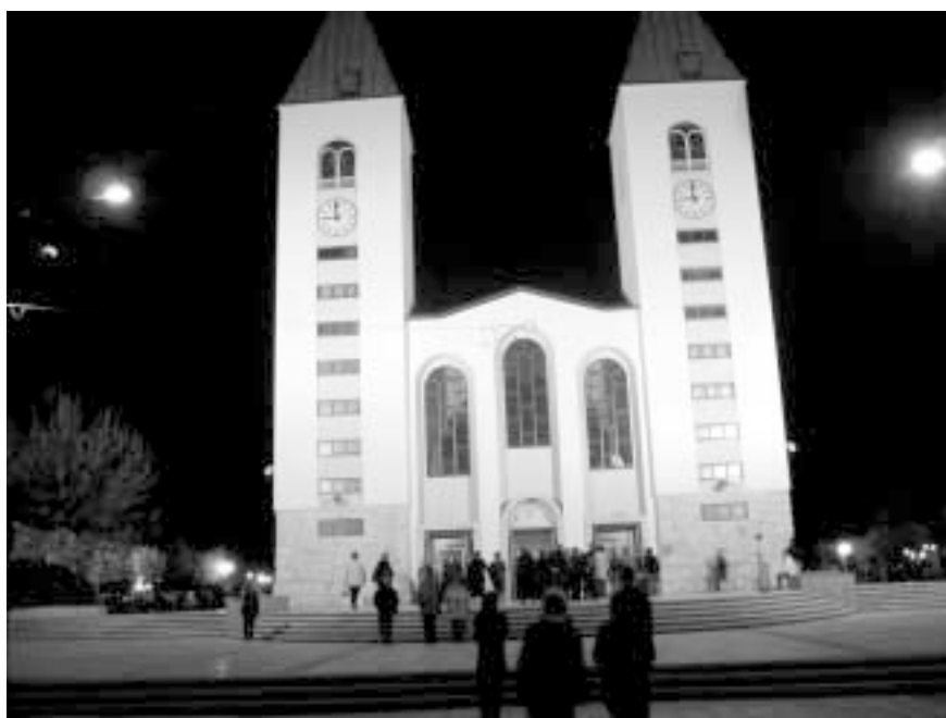
Razsvetljena cerkev v medžugorski sobotni noči