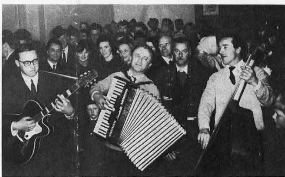
Ob dnevu emigranta v Čedadu so se beneški Slovenci pozabavali ob prijetnih zvokih znanega ansambla «Beneški fantje», ki jim je igral domače in druge pesmi

Toda zgodovina nas uči, da niso nikoli nikomur ničesar darovali, ampak, da si je bilo treba pravice vedno znova priboriti. V zadnjih 50 letih so delavci vsega sveta izboljšali