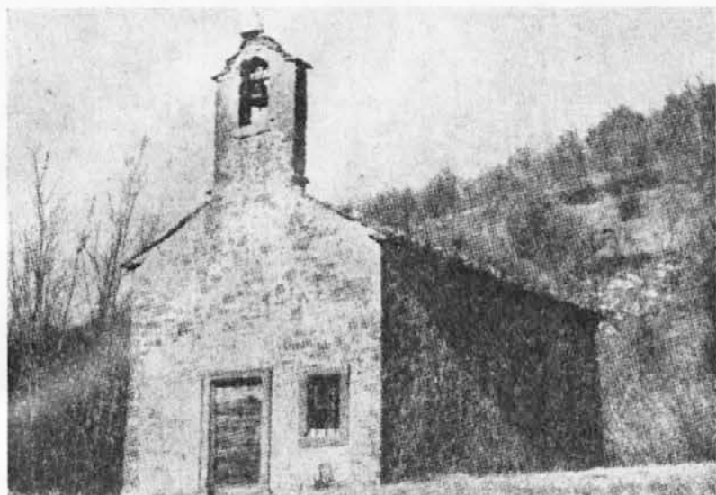
Skoraj pol tisočletja stara cerkva sv. Silvestra, ki stoji onkraj hudournika Kosce pod zaselkom Pikoni

Onkraj hudournika Kozice, v samotni dolini pod zaselkom Pikoni, se skriva v gošči stara cerkev svetega Silvestra. Zakaj so jo naši predniki zgradili v odročnem kotičku, ni prav dognano. Stari ljudje pripovedujejo, da je nastala za časa turških navalov, ko so se vaščani zaobljubili, da postavijo svetišče, če jih zavetnik obrani pred neverniki.