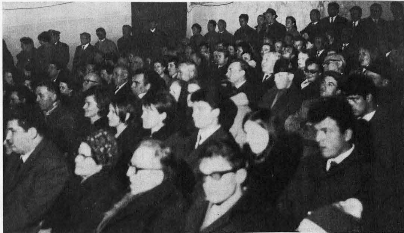
Pogled na župnijsko dvorano v Špetru ob Nadiži med gostovanjem Slovenskega narodnega gledališča iz Trsta z znano veseloigro «Anarhist». Velika udeležba je pokazala željo, naj bi to kulturno srečanje ne bilo zadnje, ampak naj postane dober začetek približevanja med Slovenci tržaške in goriške pokrajine in Slovenci Benečije.