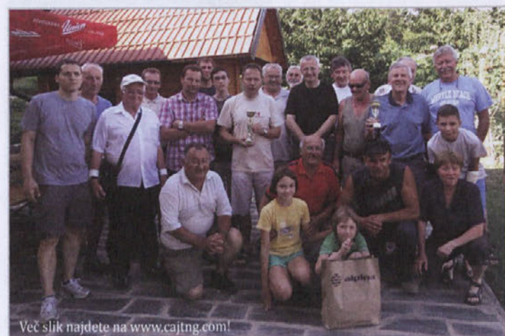
Več slik najdete na www.cajtnj.com !