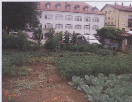
Ti vrtoy so bili pred dnevi okradeni že tretjič letos, glavna sezona pa se šele začneja. Bo potrebno postaviti strazo?

Tako, dragi ljubitelji tuje zelenjave. Za orodje je »poskrbljeno«, zdaj pa si le še omislite zemljico. Za letos zna biti prepozno za določene stvari, naredite pa plan za drugo leto (Cajtnogov kolumnist Gregor Kaplan ponuja celo drugo, še boljše rešitev). Za letos pa - pojdite raje prosit za nekaj čebulic in solate, z veseljem vam jo bodo dali marsikje. Le ne uničujte pridelkov ljudem. Sploh ne veste, da je v eni solati