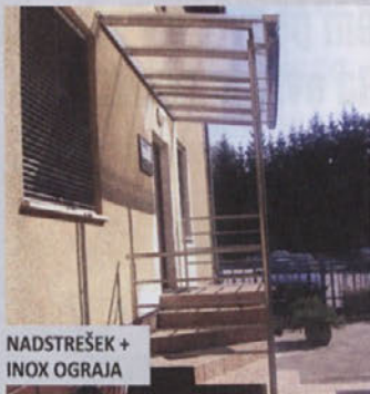
NADSTREŠEK + INOX OGRAJA

Razrez in krivljenje pločevin ter varjenje vseh materialov