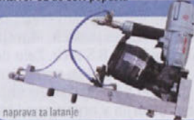
naprava za latanje

Kupovanje pri nas je cenejše, prepričajte se!