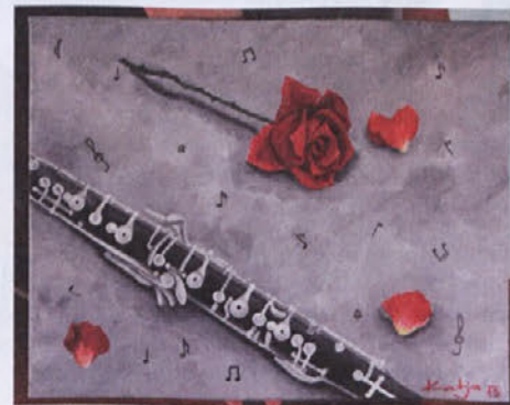
Ena od Katjinih številnih umetnin ...

Predstavljajo barve življenja, srečo, upanje. Saj tudi slikam večinoma takrat, ko sem dobre