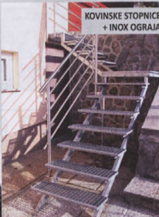
KOVINSKE STOPNICE + INOX OGRAJA