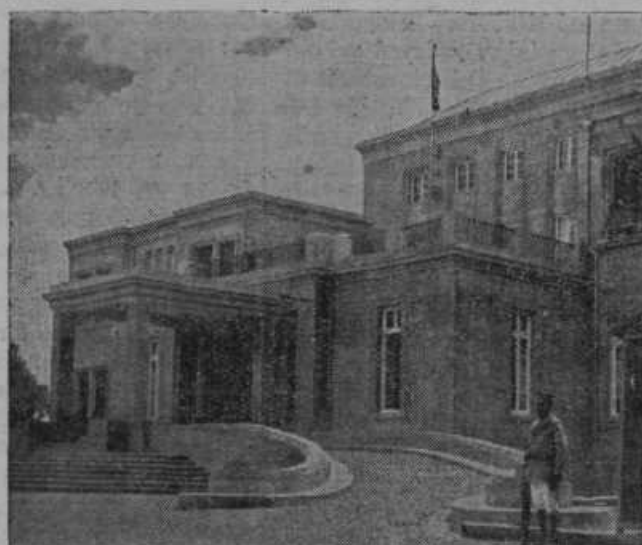
Kolodvor v Addis Abebi (levo). Cesarska palača v Addis Abebi (desno), pred opustošenjem ob predaji Italijanom.