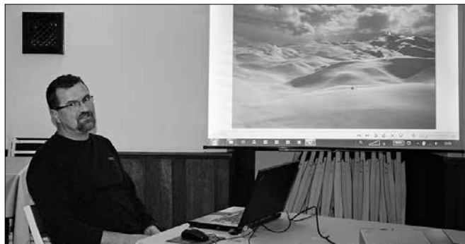
Marijan Denša je opis kraške planote obogatil s številnimi fotografijami posnetimi v vseh letnih časih.

Planota je lahko dostopna, preko leta polna različnih vrst cvetja, pozimi raj za turne smučarje. Na njej so številni ostanki postojank iz prve svetovne voj-