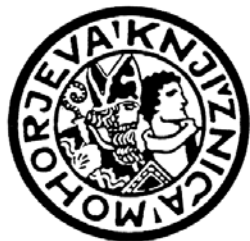
1929: Mohorjeva knjižnica 1929 (tudi 1949)