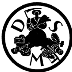
1932 (avtor: Ivan Pengov): Mohorjev koledar 1933