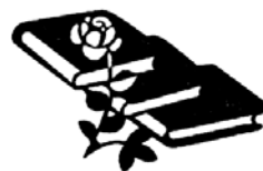
1935: Književni glasnik MD