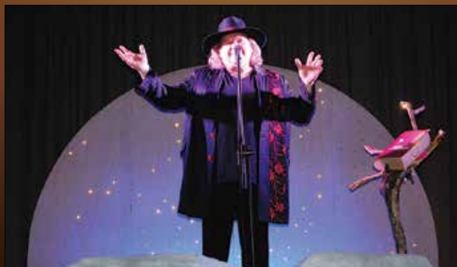
Vidmar je na ljubenskem odru pel vsem mamam sveta.

Spregovoril je o svojih potovanjih, izgubljenih letih in času, ko se je ponovno našel. Njegove zgodbe so nemalokrat nasmejale predvsem žensko publiko, velikokrat je po obrazu stekla kakšna solza. Večina njegovih pe-