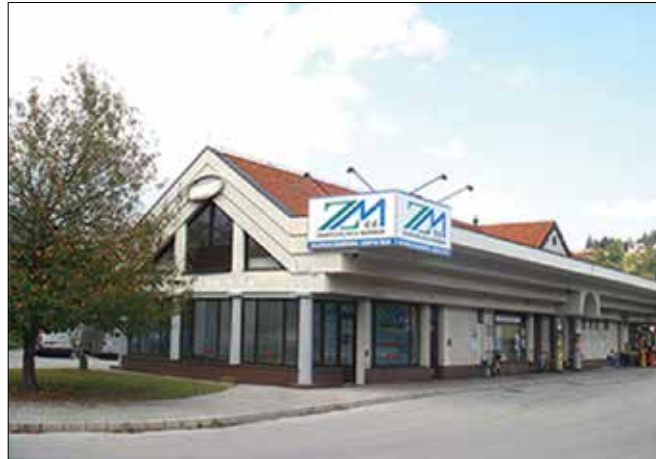
Prenovljeni poslovni prostori v Mozirju

znanitev s pogoji zavarovanj. Nepoznavanje namreč vse prevečkrat privede do slabe volje v škodnih primerih.