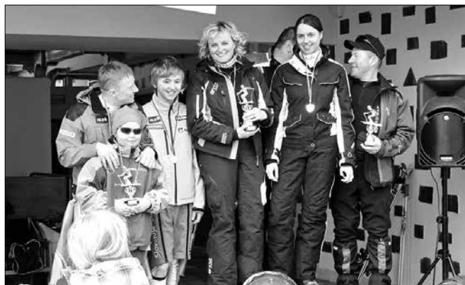
V ekipnem tekmovalju so na stopničkah stali sami Zgornjesavinjčani.

V ekipnem tekmovalju so šteli trije najboljši rezultati tekmovalcev iz treh različnih kategorij. Med 26 sodelujočimi ekipami so bili najboljši gasilci PGD Pobrež-