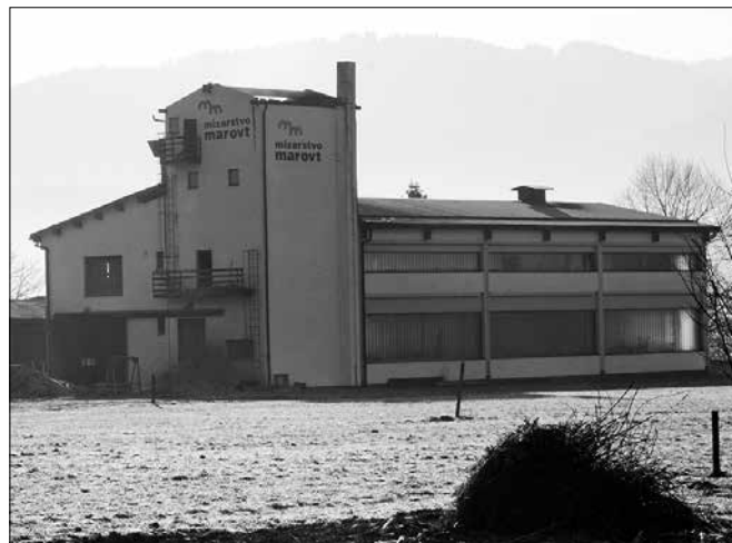
Eksplozija lesnega prahu je uničila streho silosa.

Škoda, ki jo ocenjujejo na približno 50 tisoč evrov, zajema uničeno ostrejšje objekta, ki je ob eksploziji padlo na delavnico. Močno po-