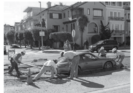
Odkar je ta avto parkiran v svežem betonu, je postal zelo ekološki. Sodil bi med zelene, če ne bi bil blaten.