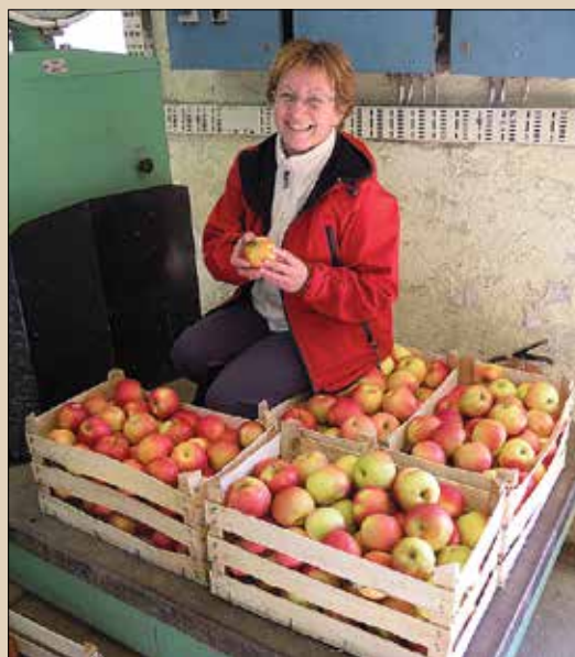
Mlinarjeva se je nagrade zelo razveselila, kajti v teh spomladanskih dneh je treba pridno uživati vitamine.