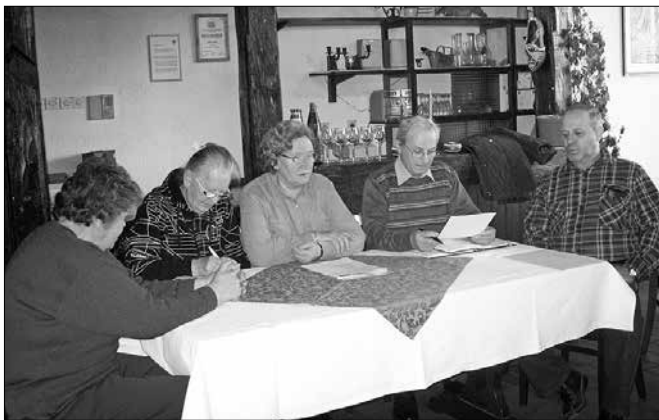
Člani gornjegrajske borčevske organizacije so sklenili, da bo v prihodnje potrebno posvetiti pozornost pomlajevanju članstva.

Člani gornjegrajske krajevne organizacije Združenja borcev za vrednote NOB so se konec februarja zbrali na rednem letnem občnem zboru. Krajevni odbor šteje 60 članov, članstvo aktivnih udeležencev NOB se zmanjšuje, zato bo v prihodnje potrebno posvetiti pozornost na pomlajevanju. Ideja in vedenje o pridobitvah NOB ne smeje zatoniti v pozabo.