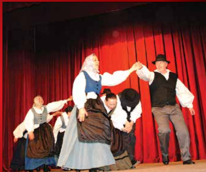
Folklorni plesalci so odplesali številne stare ples.

Uvodoma je nastopajoče in obiskovalce pozdravila predsednica domačega kulturnega