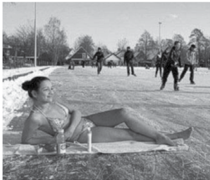
Do nadaljnjega takšnih slik v Zadrebških novicah ne bo več možno videti. Mislimo na sneg in led v ozadju.

Glas iz kuhinje: „Pa kaj misliš, da sem jaz, stoletna pratika, da bi vedela?“