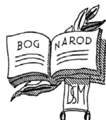
1928 (avtor: Boris Kobe): osnutek