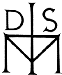
1937: Cvetje iz domačih in tujih logot; Književni glasnik MD 1939