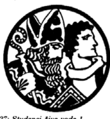
1937: Studenci žive vode I (S. Cajnkar, Luč sveti v temi); Mohorjevi koledarji po letu 1946