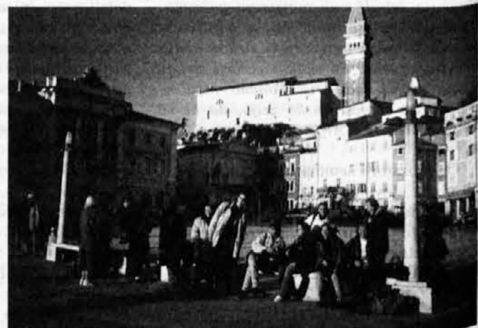
Na Tartinijevem trgu v Piranu