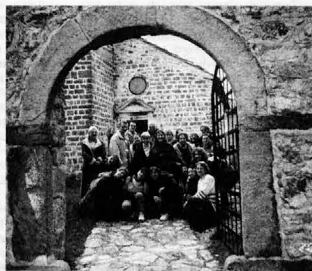
Pred znamenito cerkvijo v Hrastovljah