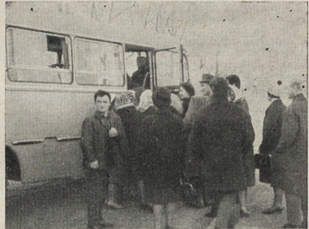
Pred vhodom v Induplati so se zbrali v ponedeljek 22. marca krvodajalci. Za akcijo se je prijavilo 139 članov kolektiva

Kot priporočilo za pisanje si oglejmo naš dnevni tisk (Delo-rubrika bralcev, Pavliha, TT itd). Zato, dopisniki na dan s preprosto besedo!