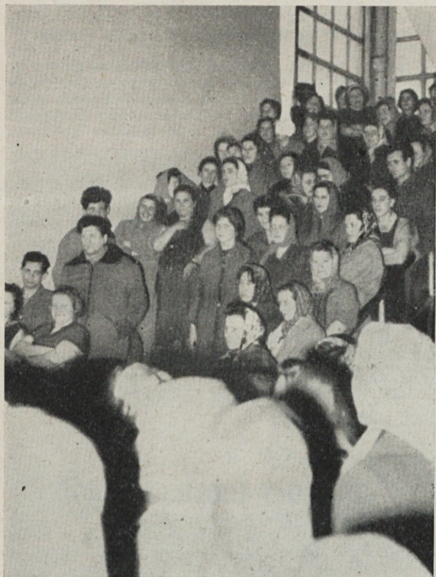
Predvolilni sestanek v predilnici

Ko smo zapisali kronologijo prireditve lahko ugotovimo, da je tudi ta, sedaj že davno tradicionalna prireditev, postala resnično manifestacija zavesti naših delovnih žena. Tolikšen obisk komaj kdaj zabeležimo in to nas veseli in krepi v zavesti, da smo složni v želji za doseg skupnih ciljev v proizvodnji in dvigu življenjske ravni delovne žene.