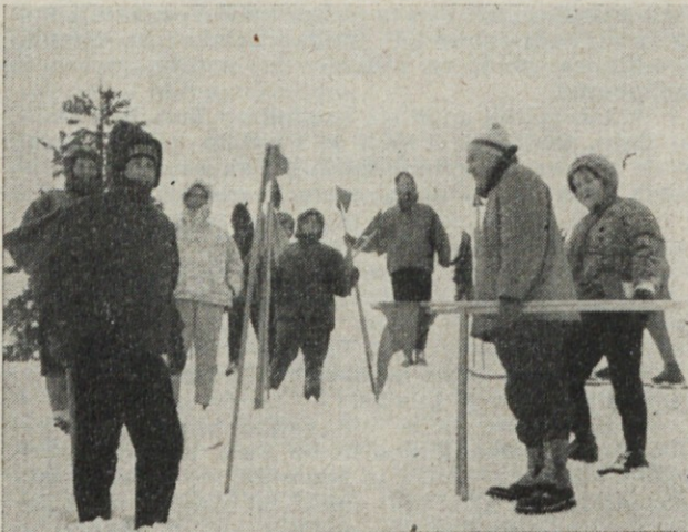
Izlet na Veliko planino pozimi. Na startu naših smučarjev