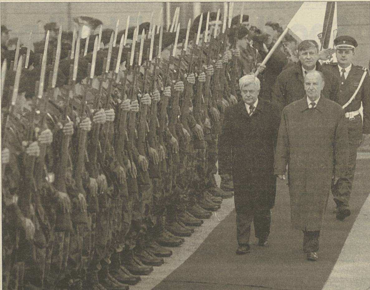
Alija Izetbegović je Milana Kučana sprejel z najvišjimi državnimi častmi

Z njimi se je predsednik Kučan dogovoril, da bodo svoja pričakovanja ubesedili v pisnem memorandumu, ki ga bodo naslovili na slovensko vlado. Ob koncu izjave je predsednik Kučan dejal, da Slovenija uživa izjemen ugled v BiH, predvsem zaradi načelnih stališč, ki jih ni prilagajala labilnemu odnosu sveta do Bosne, in znova zatrdil, da je Slovenija pripravljena sodelovati pri obnovi BiH, za dobro sodelovanje na tem področju pa so potrebni projekti, ideje in sredstva, pri čemer se je po mnenju slovenskega predsednika treba opreti tudi na nekdanje (gospodarske) zveze. Kučan je povedal, da so sogovorniki iz BiH že omenjali konkretne zadeve, denimo premoženjskopravne odnose in problem Ljubljanske banke, ki so v odnosih med državama se neresene.