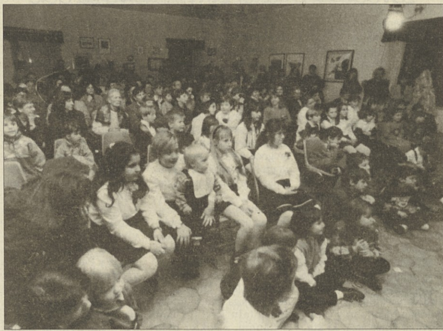
Prešernova proslava v Ricmanjih je bila posvečena najmlajšim