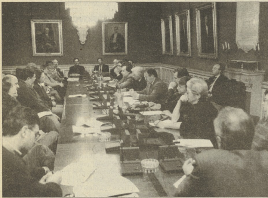
Včerajšnje predstavitev Trga Gutenberg se je udeležilo veliko ljudi

Podrobnejši program knjižnega trga bo znan čez mesec - Pristop Trgovinske zbornice