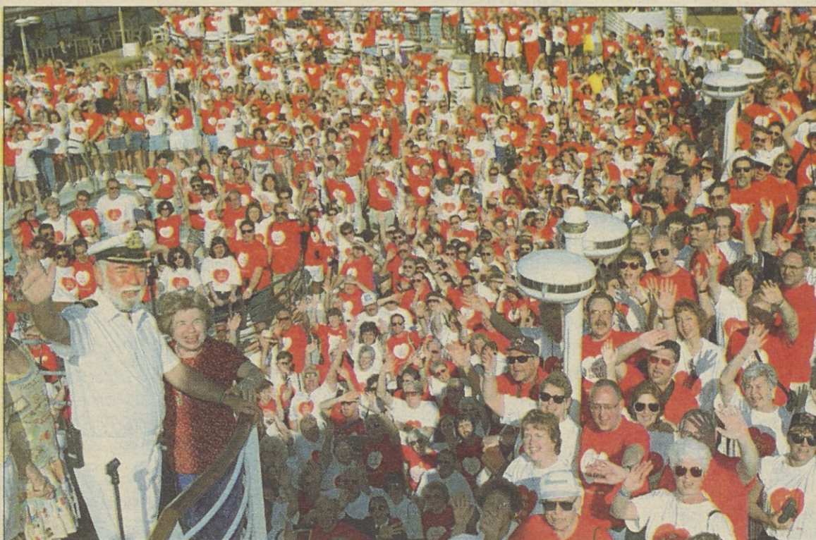
600 ameriških zakonskih parov je sklenilo, da bo letošnje Valentinovo prežvelo na krovu ladje Sun Princess