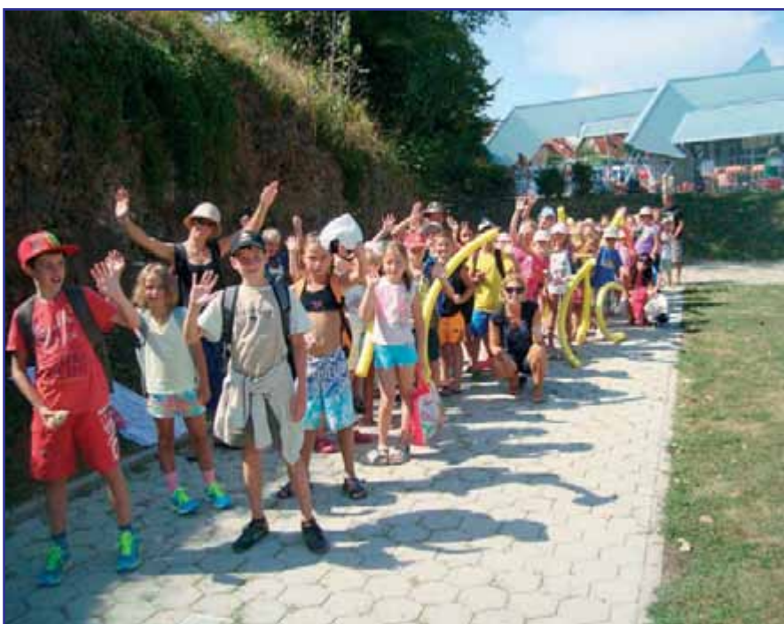
Tudi kopali smo se.