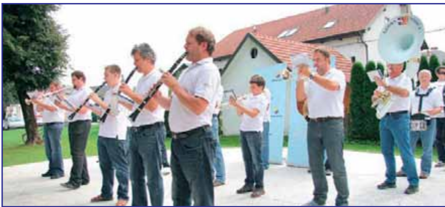
Člani Godbe Vodice; nekateri so vzeli tudi dopust.

da ima linije za darilo, saj je v septembru ta javni zavod praznoval 111 let. Linije bodo še preučili in jih prilagodili lokalnim potrebam. Ljubljanski župan Zoran Jankovič pa nam je čestital ob prazniku in komentiral, da imamo župana z veliko vizijo in ogromno energije. »Zdaj bodo Vodice hitreje prišle v Ljubljano in Ljubljana k vam.«