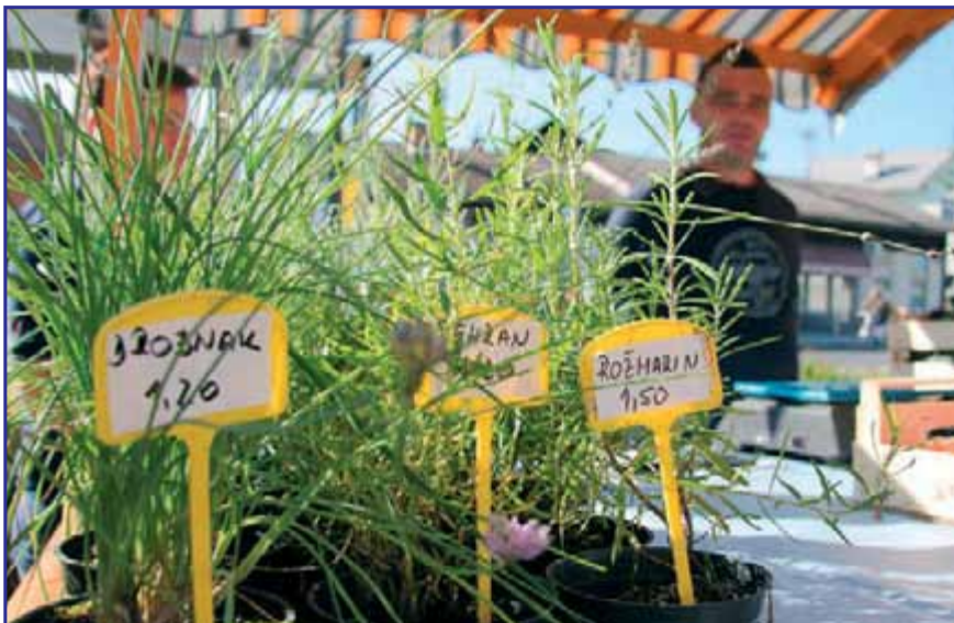
Od zelenjave in zelišč do ovčjih kož in umetniških izdelkov.