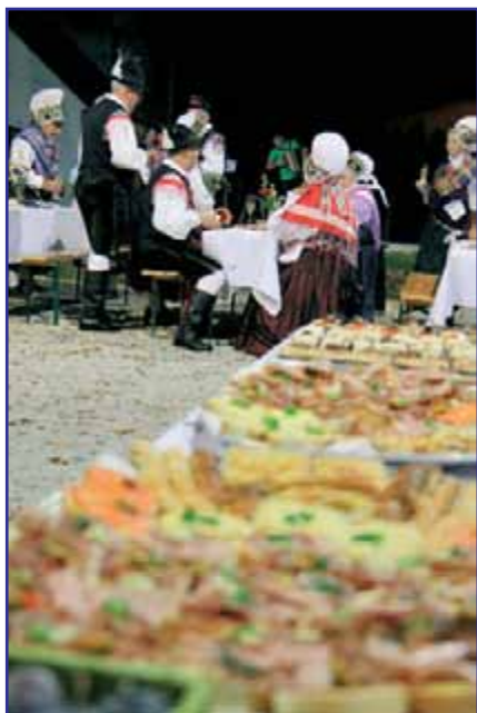
Za pogostitev so poskrbeli člani DU Vodice.