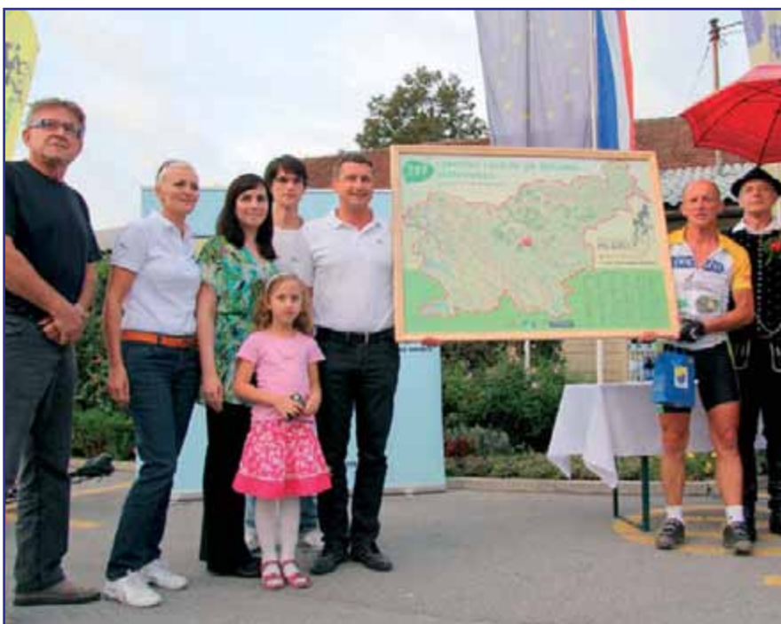
Ultramaratonec je prilepil lipov listek tudi na Vodice.