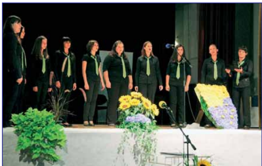
Dekliška vokalna skupina Flora