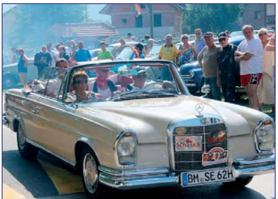
Tudi župan se je z ženo popeljal v koloni starodobnikov.