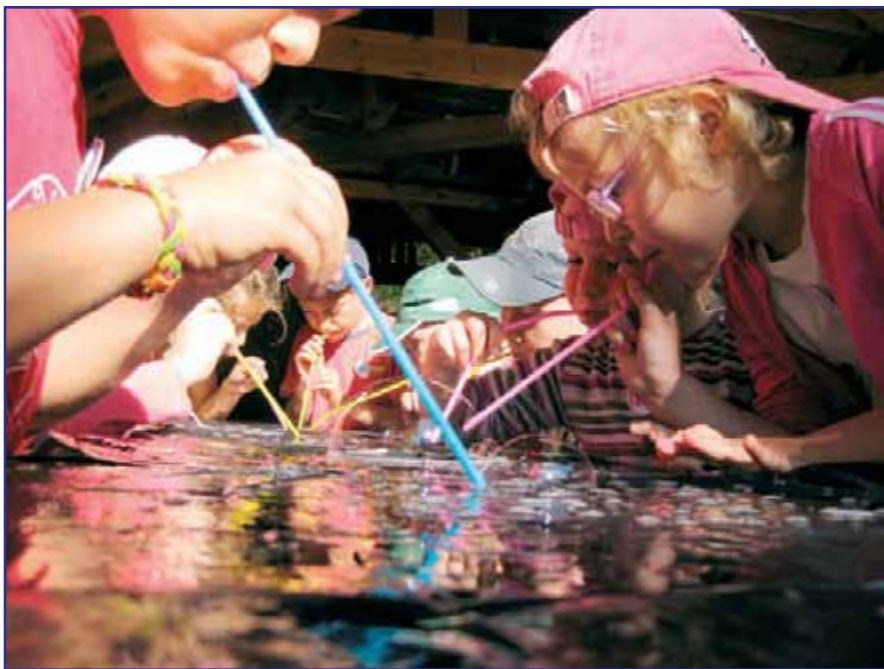
Igranje v družbi prijateljev.