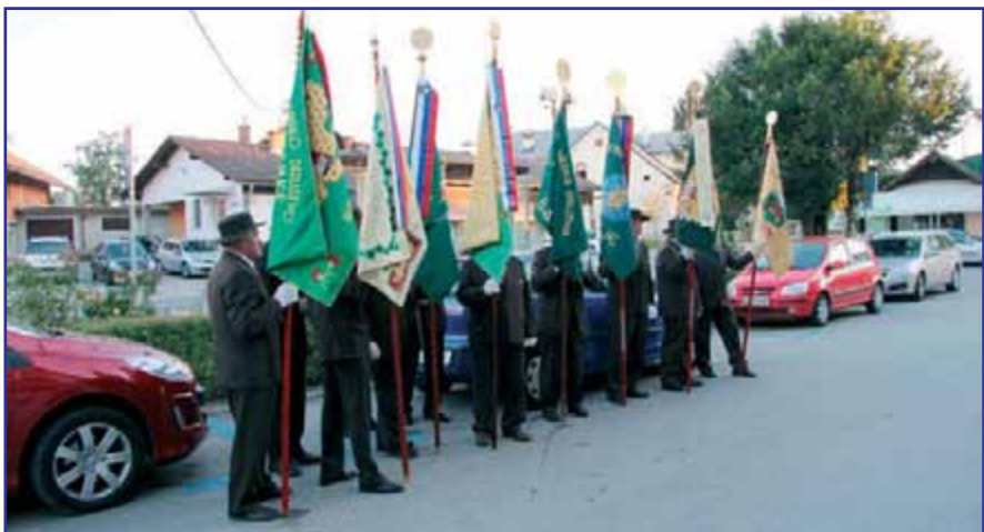
Čebelarski praporščaki iz različnih občin in društev.