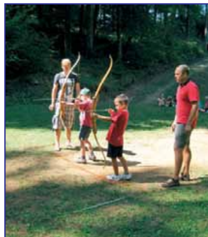
Napnite lok, spustite, zadetek!