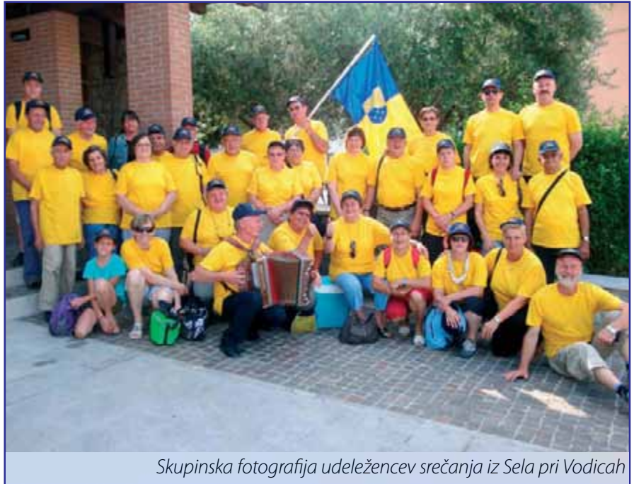
Skupinska fotografija udeležencev srečanja iz Sela pri Vodica

Po predstavitvi vseh prisotnih vasi na srečanju, ki so se to pot skupaj z domačini ustavile pri številki 28 (vseh udeležencev pa je bilo okoli