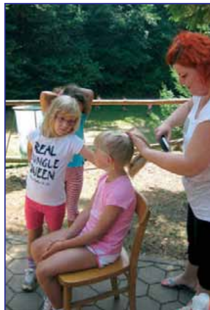
Lepe s pomočjo frizerskega salona Jo-las