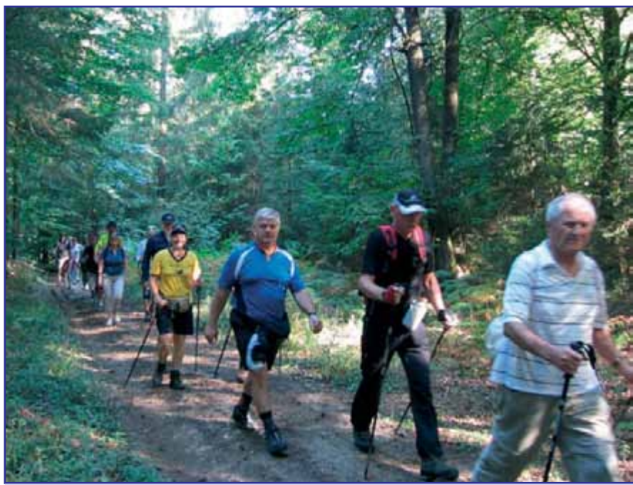
Pohodniki so imeli lepo vreme.