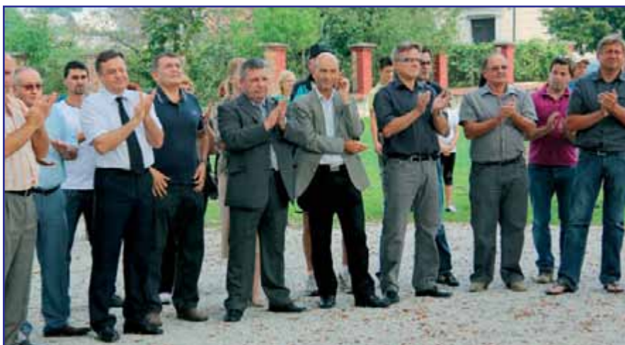
Gostje in svetniki na otvoritvi.