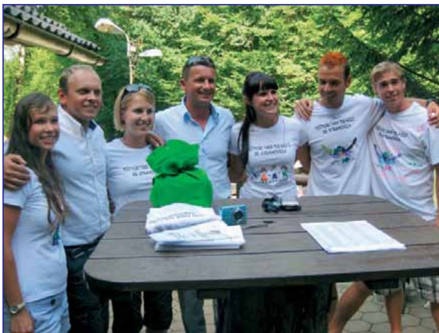
Animatorji z županom

vali z milnimi mehurčki, izdelovali ekoavtomobilčke in tako s čudovitimi izdelki dokazali, da smo tudi pravi umetniki. En dan je bil namenjen tudi kopanju – obiskali smo letno kopališče v Kranju. Še najbolj nestrpnost smo čakali na četrtkovo popoldne, ko je bilo na sporedu kurjenje tabornega ognja in postavljanje šotorov na prostem, a nam je deževje na žalost to preprečilo. Kljub temu se nismo vdali, saj smo taborjenje prestavili v telovadne prostore POŠ Utik, taborni ogenj pa vseeno zakurili ob koči SD Strahovica, na katerem smo si tudi pripravili svojo večerjo. Najprej je bilo treba nabrati in ošiliti palice, nato pa si je vsak otrok sam spekel hrenovko. Tako siti smo še malo posedeli ob žerjavici ter se nato z baklami in lučkami odpravili proti našemu prenočišču. Naslednje jutro smo začeli z jutranjo telovadbo in se nato odpravili proti koči na zajtrk. Sledile so priprave za prihod