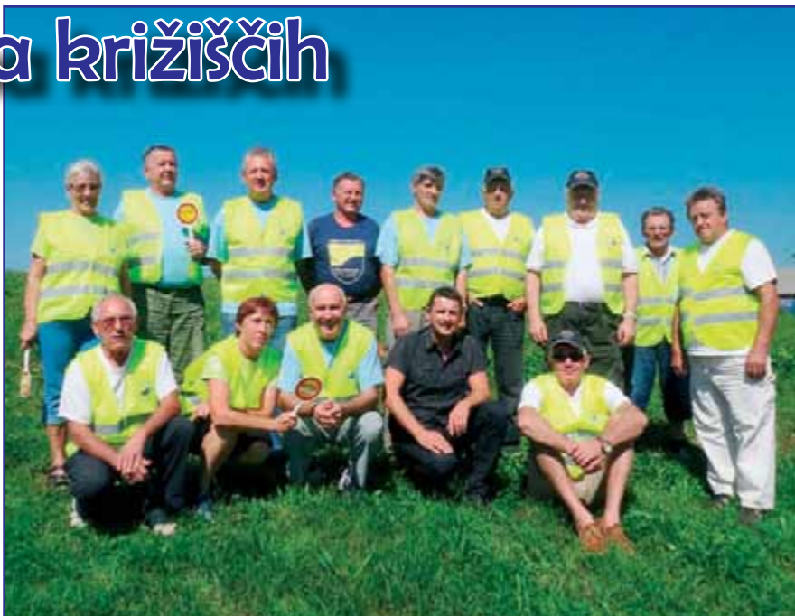
Varovali so naše šolarje.

Kar 15 prostovoljcev je potrebno za vsa križišča, avtobusno postajo v Zapogah, pred šolo v Utiku in v Vodica. Res so to že več let isti ljudje, ki z dobro voljo in odgovornostjo ves teden varujejo naše šolarje v tem norem cestnem prometu. Pripravljene so na varovanje kljub žaljivkam, ki so jih deležni pred šolo v Vodica. »Naj občina uredi parkirne prostore,« je mogoče slišati najpogosteje. Letos je