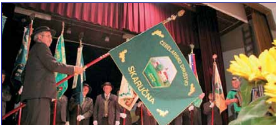
Vodiški čebelarji so dobili svoj prapor.