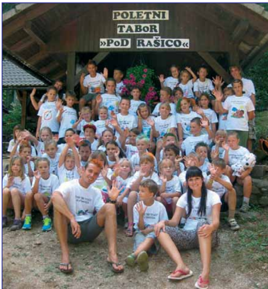
Letošnji tabor je imel ogromno udeležencev.

Naš vsakdan se je odvijal v prostorih in okolici koč SD Strahovica, začeli pa smo ga ob 8. uri zjutraj. Takrat smo se zbrali na našem zbirnem mestu, ki smo ga poimenovali Pri Bedancu. Kot za simbol smo na to mesto postavili tudi risbo omenjenega pravljičnega lika. Po jutranjem pozdravu in navodilih za posamezni dan smo nadaljevali z različnimi