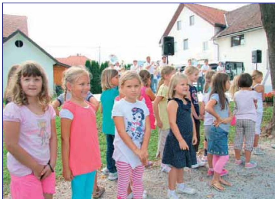
Ubrano je zapel otroški pevski zborček.