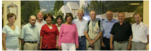
Slovenci V Malmöju se redno zbirajo ob raznih prireditvah.