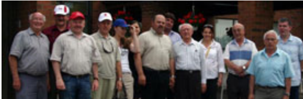
Komisija za Slovence po svetu je obiskala tudi dom za ostarele v Torontu. Zgleden primer sodelovanja Slovencev v Kanadi.