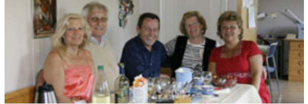
Sestre Budja so dobro znane po svojih pevskih nastopih po vsej Evropi.