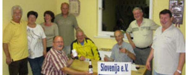
Slovenci v Berlinu se zbirajo, malo pokvartajo in se redno vozijo domov, v Slovenijo seveda.