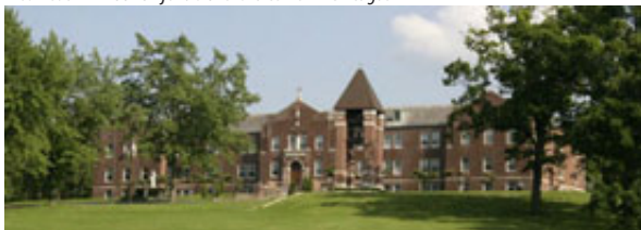
Ameriške Brezje, veličasten spomenik slovenstva v Ameriki ...