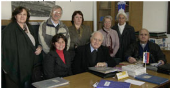
Profesorski zbor v Buenos Airesu.

Če sem koga izpustil, se opravičujem; preveč je bilo vtisov, preveč dobrih besed in domačnosti.