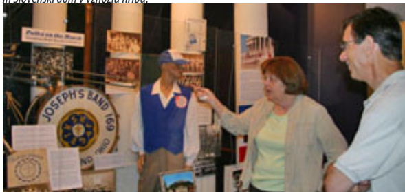
Muzej slovenske polke je nekaj posebnega, tokrat so imeli razstavo pihalnih godb.