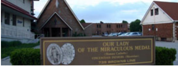
V Torontu je veliko slovenskih objektov. Eden od njih je center, kjer je vse od cerkve do šole in ustanov bančništva.