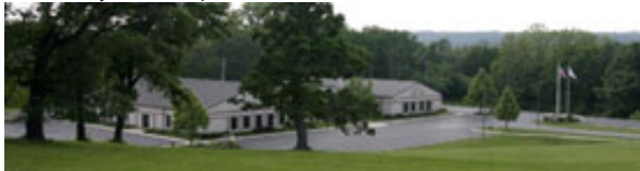
in Slovenski dom v vznožju hriba.