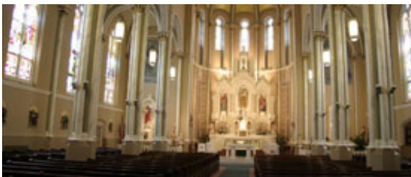
Pred nedavnim obnovljena slovenska cerkev v Chicagu.