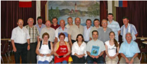
Samo nekaj kilometrov od slapov Niagare je slovenski dom Bled, kjer sem se srečal s predstavniki doma in delegacijo iz Komisije za Slovence po svetu.