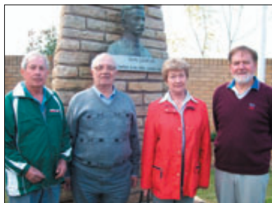
Tekmovalci iz Wollongonga in Canberre.

Vse več ljudi se zanima za redne enodnevne avtobusne izlete, ki jih vsak mesec organizira klub Triglav Panthers. Izleti, ki jih uprava kluba podpira s prispevkom po $10 na osebo za vsakega člana, so odprti vsem, največ pa se običajno