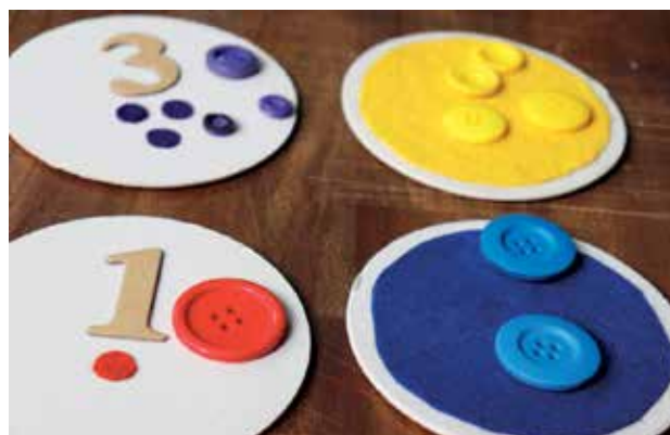
Slika 6: Podlage za razvrščanje predmetov glede na prepoznano lastnost.

preverijo na hrbtni strani podlage, kjer je pravilno število gumbov opredeljeno s simbolnim in konkretnim zapisom (s števkami ter grafično).