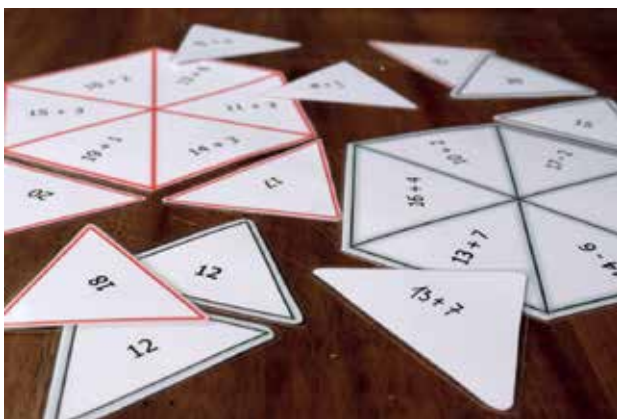
Slika 1: Računske sestavljanke.

Pri uporabi različnih didaktičnih pripomočkov za dejavnost otrok, lahko na hrbtno stran pripravljenih kartončkov zapišemo rešitev (slika 1). Tako lahko otroci po opravljeni nalogi sami preverijo, ali so račun pravilno izračunali ali ne. Tovrstna kontrola napake omogoča ponavljanje in utrjevanje že izračunanih računov. Pri načrtovanju posameznih nalog lahko v samo strukturo računskih operacij vpletemo primere, ki otrokom pomagajo prepoznavati vzorce ter usvajati posamezne pomembne matematične zakonitosti (npr. ohranjanje razlike, zakon o zamenjavi), ki jih preko reševanja samostojno ozaveščajo. Ta način je še posebej dobrodošel pri utrjevanju poštevanke, saj otrokom omogoča vajo ponavljanja v lastnem tempu, hkrati pa se otroci urijo v znanju poštevanke.