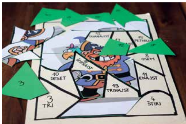
Slika 5: Branje in štetje naravnih števil do 20.

polaganje koščkov vodi do zelenega končnega cilja – sestavljene slike. Otroci med delom primerjajo števila in iščejo ustrezne pare. Veliko otrok pa se odloči tudi za sestavljanje slike na podlagi prepoznavanja oblik posameznega koščka sestavljanke. V tem primeru je na mestu, da nas zgolj pravilno sestavljena slika ne zavede pri vrednotenju znanja posameznega otroka.