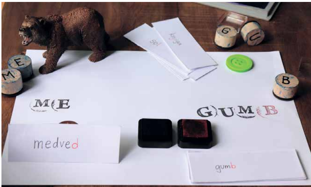
Slika 7: Težje besede.

Učni načrt. Program osnovna šola. Slovenščina . (2011). Pridobljeno 30. 10. 2018 s spletne strani http://www.mizs.gov.si/fileadmin/mizs.gov.si/pageuploads/podrocje/os/prenovljeni_UN/UN_slovenscina_OS.pdf .