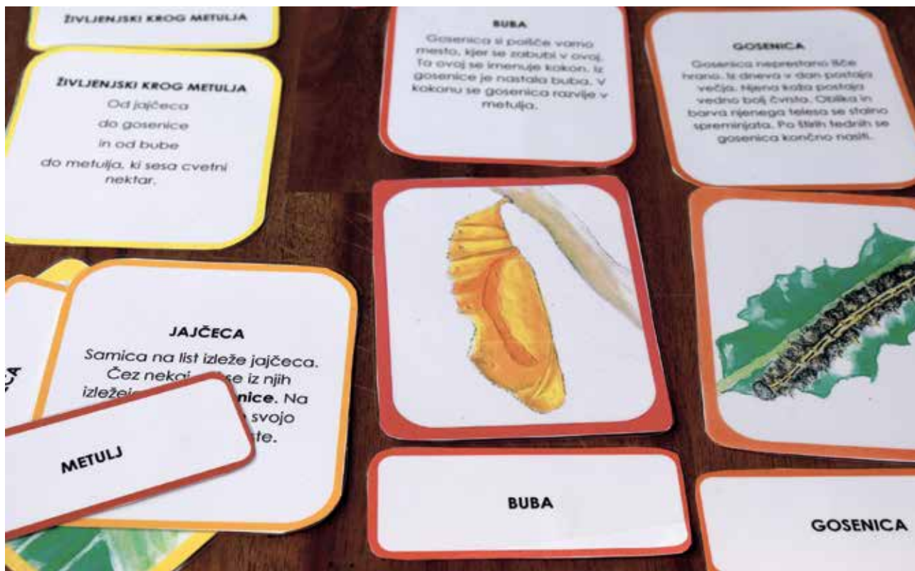
Slika 4: Kartice za sestavljanje življenjskega kroga metulja.

polaganje koščkov vodi do zelenega končnega cilja – sestavljene slike. Otroci med delom primerjajo števila in iščejo ustrezne pare. Veliko otrok pa se odloči tudi za sestavljanje slike na podlagi prepoznavanja oblik posameznega koščka sestavljanke. V tem primeru je na mestu, da nas zgolj pravilno sestavljena slika ne zavede pri vrednotenju znanja posameznega otroka.