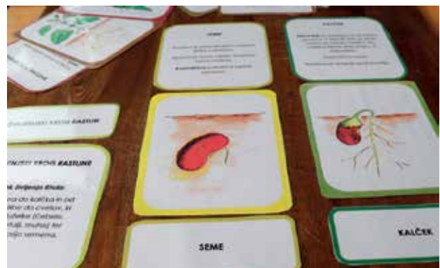
Slika 3: Kartice za sestavljanje življenjskega kroga fižola.

Ujemanje ustreznih parov lahko ponazorimo z enakimi barvami ali barvnimi odtenki (slika 3 in slika 4). Prikazane trodelne kartice vodijo dejavnost otrok od branja z razumevanjem do ustreznega razporejanja posameznih faz v življenjskem krogu metulja in fižola. Vsaka posamezna faza je predstavljena s pomočjo treh kartic. Na eni kartici je slika, ki prikazuje določeno stopnjo v razvoju živali ali rastline. Na drugi kartici je preprost opis. Tretja kartica pa s ključno besedo poimenuje fazo življenjskega kroga. Enaki barvni okvirji kartic otrokom omogočajo, da sami ugotovijo, ali so tvorili pravi življenjski krog ali ne. V nadaljevanju dela pa otroci tvorijo zapis življenjskega kroga v zvezek in posamezne faze ustrezno ilustrirajo.