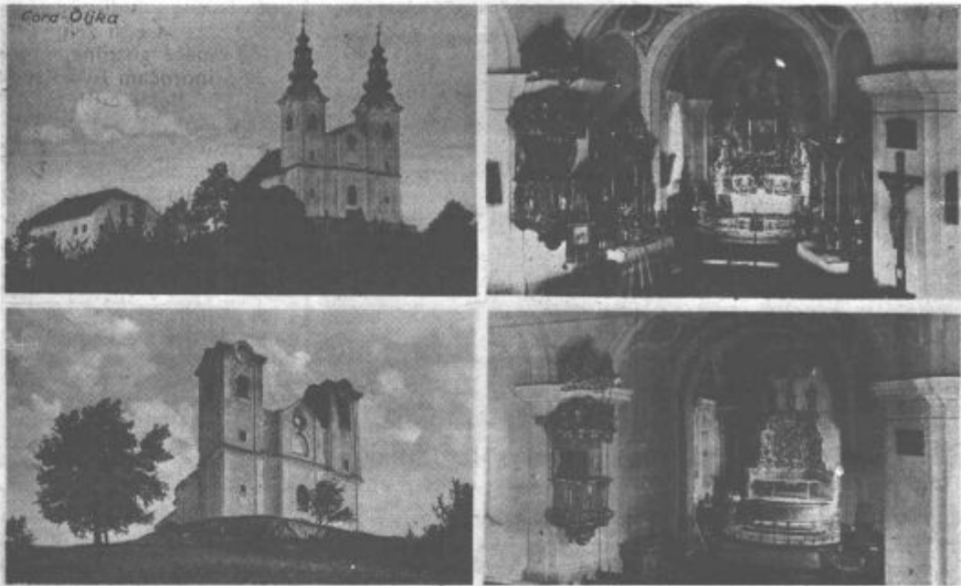
Tole zanimivo najstarejšo fotografijo, ki jo objavljamo tokrat, nam je prinesel S. T. iz Soštanja. Kot ste lahko že sami spoznali, je na njej gora Ojka po požaru. Razglednica je bila napisana leta 1932.