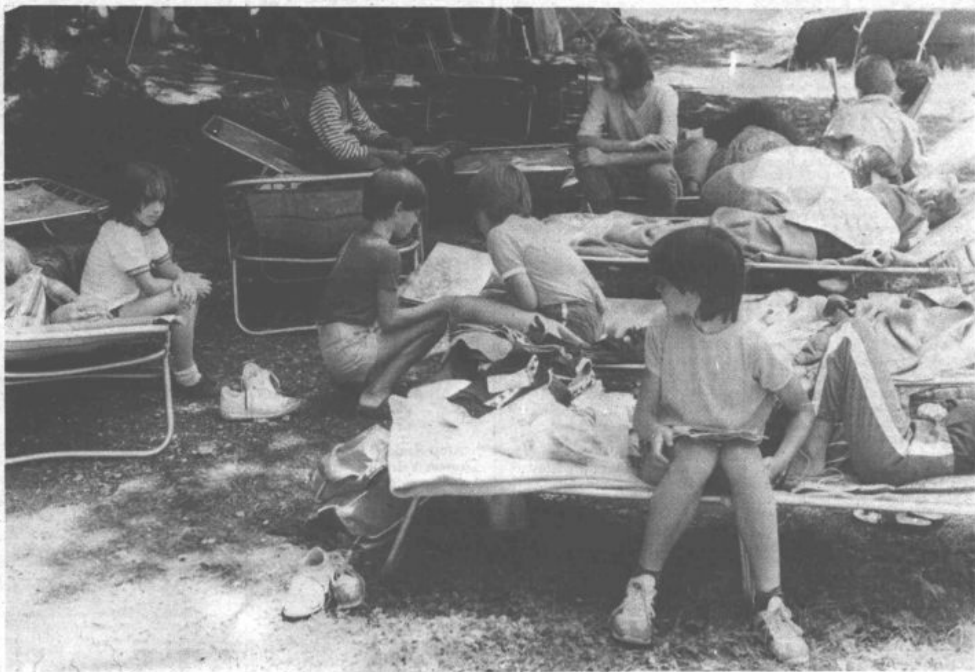
Tako — že nekaj časa je pravo poletje. Vroče je na vsakem koraku, razen v senci.

Strokovne službe pri skupnosti za zaposlovanje občine Velenje menijo, da bi morali v tem trenutku nameniti vso skrb predvsem ustreznemu zaposlovanju šolanega kadra oziroma letošnje šolske generacije. Trend rasti brezposelnosti nekvalificiranih delavcev na isti tehnološki ravni je lahko resno opozorilo na pešanje gospodarstva. Odstopanje od začrtane usmeritve intenzivnejšega razvoja in prestrukturiranja kadrovskega potenciala ni prava pot. Treba ga je preusmeriti s programi doizobraževanja.