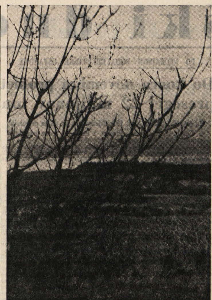
Jesenski motiv na Krasu

JUG TELEVIZIJA 20.00, 23.05 Poročila; 9.35 TV v šoli; 14.40 Hokey Partizan; Slavija; 17.45 Beneški fantje; 18.15 Veliki potepuh; 19.15 Sprehod skozi čas; I. svetovna vojna; 19.40 Za boljši jezik; 20.35 Zabavno-glasbena oddaja; 21.35 Slan in Olio; 21.55 Novi rod - film; 22.45 TV kažipol.