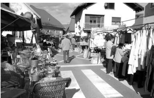
Se prodaja in kupuje.