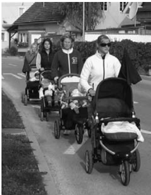
Najmlajši na pohodu.

Od 1. januarja 2007 pa do 11. novembra 2009 se je v naši občini rodilo 517 otrok, od tega 266 dečkov in 251 deklic. V istem obdobju je v logaški občini umrlo 242 ljudi, od tega 123 moških in 119 žensk. Med umrlimi je bilo 180 oseb starih nad 69 let, mlajših od 69 let pa 62.