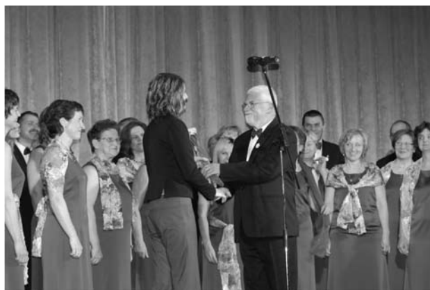
»Notranjska« organizator lušnega nedeljskega popoldneva.