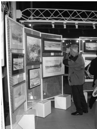
Sredi snežne pravljice.

Bil je dan po martinovem; svečke okoli Steklene galerije so naznanjale otvoritev letošnje že osme skupinske razstave Društva likovnikov Logatec