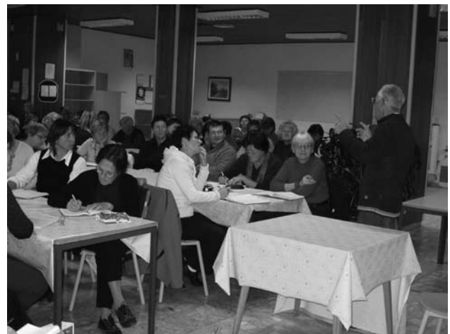
Maršič med Ognjičarji.