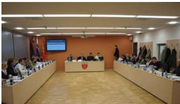
Dovolj svetlobe in zračnega prostora v novi dvorani.