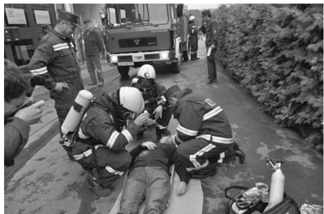
Ko je zagorelo – za vajo!

K sreči je šlo le za uspešno gasilsko vajo, ki je bila v načrtu predvidenega izobraževanja gasilcev in osebja Doma starejših v zvezi z reševanjem nepokretnih oskrbovancev. Dobro, da ni bilo treba resničnega gašenja gašenja, saj bi bilo vode samo iz gasilskih vozil kaj