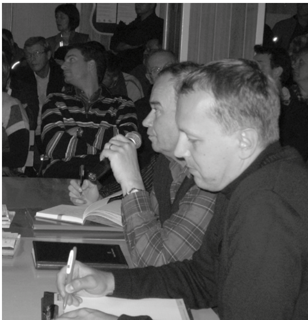
Infrastrukturo sta Martinjcem predstavila župan J.Nagode in v.d. direktorja komunale I. Petek.

Sestanka se je udeležilo 75 prebivalcev Martinj hriba.