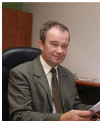
Župan navdušen nad dosežki.

Vsak projekt je bil po svoje zanimiv. Za najtrši oreh pa mirne duše štejem Upravni center. Celoten projekt je trajal