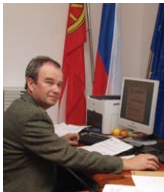
Župan v svoji novi pisarni.

Gospod župan, smo v novih prostorih. Kako se počutite v njih?