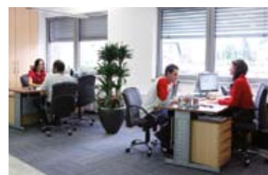
Prenovljeni prostori so prijazni za stranke in zaposlene