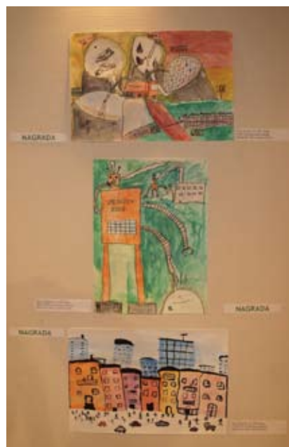
Nagrajena likovna dela; od zgoraj Nejc, David in Gaje

Lepo. Prav je bilo, da so Ta veseli dan kulture obeležili naši najmlajši, vendar kake druge prireditve na ta dan v Logatcu, žal, ni bilo. Te, v Stekleni dvorani, se je udeležil tudi župan, spregovoril mladim in njihovim mentorjem ter staršem namenil besedo pohvale. Morda pa je prav, da si bomo letošnji Prešernov rojstni dan zapomnili prav po razmišljanju o ekologiji in kulturi nas vseh skozi oči in peresa najmlajših.