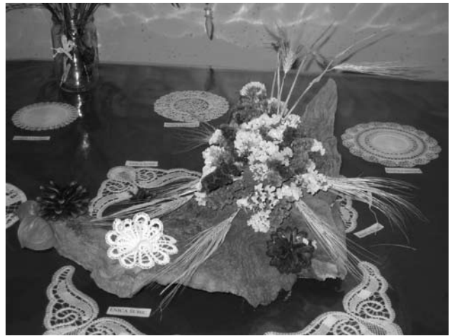
V svetu vrhovskih čipk.

V štirih dneh si je njihovo delo ogledalo mnogo domačinov pa tudi nekaj »sosedov« je prišlo naokoli.