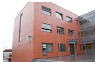
Multifunkcijski bančni avtomat