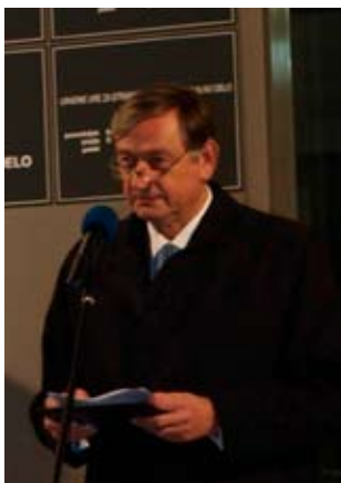
Predsednik Türk, slavnostni govornik