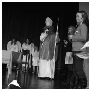
Miklavž v Narodnem domu in vsepovsod.