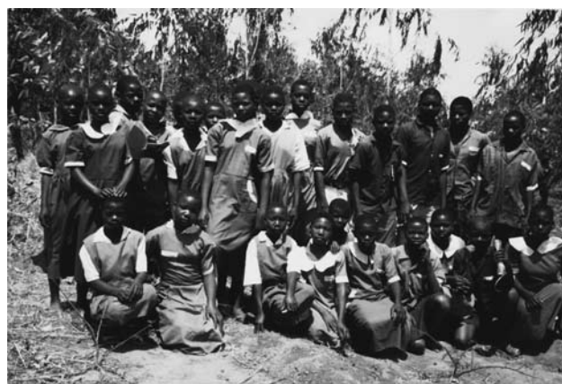
Prijatelji iz Malawije.

Že v naslednjem mesecu načrtujemo zbiranje knjig v angleškem jeziku, saj se v tem jeziku sporazumevamo z njimi.