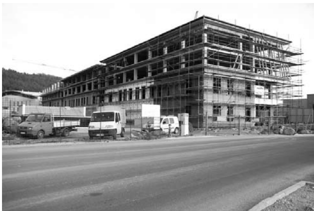
Bomo bolj zdravi ali bolj podjetni?