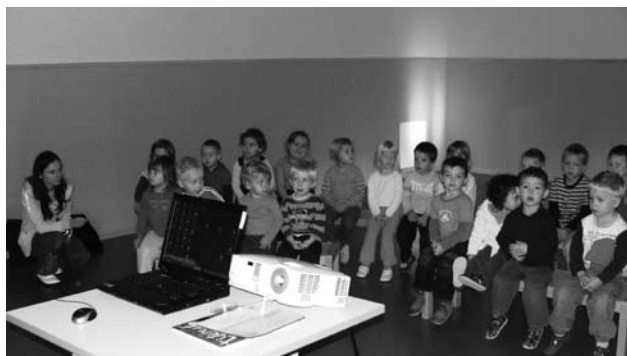
Zvedavo poslušanje o čebelarstvu.

Pa še dve izjavi majhnih, zvedavih poslušalcev iz vrtca Kurirček. Najprej je petletni Anže korajžno zapel Slakovo pesem Čebelar. Na koncu pa pribil: »Čebelar bom, ko bom velik. Do takrat pa se bom naučil še kakšno pesem o čebelah«. Ena od deklic pa je ob pogovoru o stanovalcih v panju kratko in jedrnato