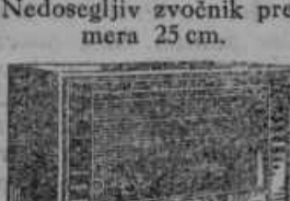
D 707 WKK