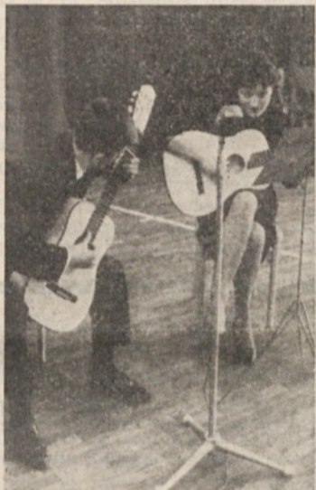
Kitara je v zadnjem času zelo popularen inštrument

Naš oddelek v Polju pripravlja godbenike tudi za papirni-