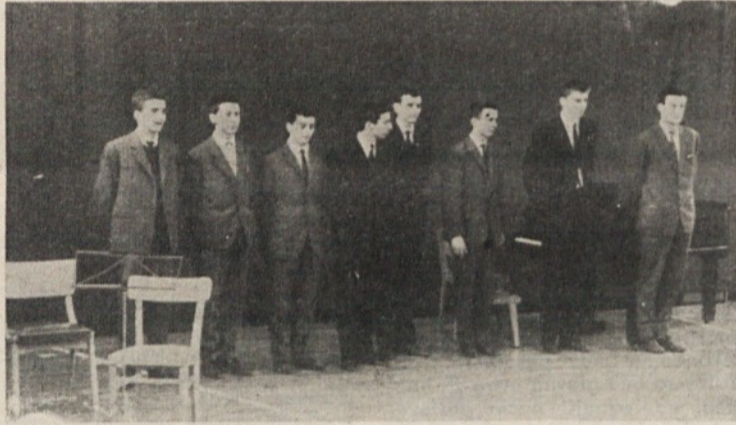
Mladinski vokalni oktet na enem od svojih nastopov

Največ težav nam že več let povzročajo delovni prostori v Mostah, ki so v zelo stari stav-