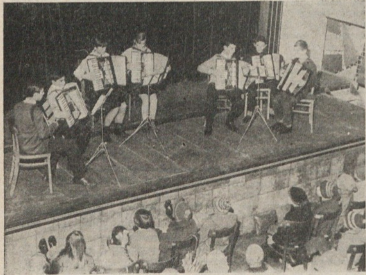
Ansambel mladih harmonikarjev je požel že lepe uspehe

Na začetku sezone so uredili klubski prostor, ga opretili s klubskimi mizicami in televizijskim aparatom ter pričeli z organiziranim spremljanjem televizijskega sporeda. Ker je to prvi in edini televizor v kraju, obisk iz dneva v dan raste. V popoldanskih urah se tam radi zadržujejo mladi, zvečer pa predvsem odrasli, ki se največ zanimajo za športne oddaje, filme in domače drame.