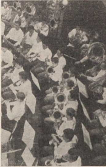
Mladinska godba na pihala

bi. Zaradi izrabljene vodovodne instalacije so potrebna stalna popravila. Še huje je z ogrevanjem. Dimniki niso prilagojeni kapaciteti številnih peči, zato nam često dimijo, peči ne