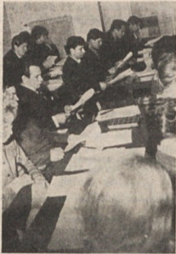
Delegati na lanskoletni mladinski konferenci

ustrezne rešitve. Organizacija kot taka torej še ni preživela in še precej časa ne bo, pač pa se mora njena dejavnost uskladiti z današnjo stopnjo družbenega dogajanja, predvsem pa se mora nenehno prilagajati reformnim zahtevam.