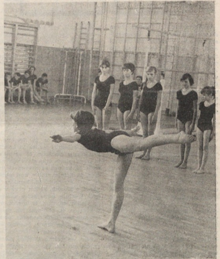
Telovadba vsebuje obilo elegancije in gracioznosti

Kvaliteta tekmovanja med pionirji in pionirkami kaže, da je SPENT le navdušil mladino za namizni tenis, ki ga igra sedaj že dokaj kvalitetno.