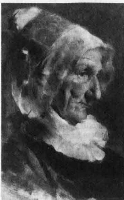
Ivana Kobilca, Študija starke z avbo

Ivana Kobilca (1861-1926) in Ferdo Vesel (1861-1946) pripadata z Janezom in Jurijem Šubicem, Jožefom Petkovškom in Antonom Ažbetom generaciji slovenskih realistov. Povezuje ju skupno rojstno leto 1861 in isti rojstni kraj Ljubljana.