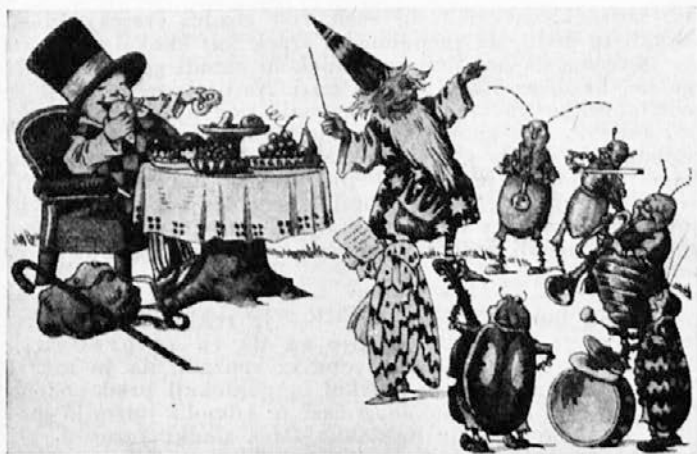
Po slaščicah je segal z veliko vnemo.

nil je v slovo angelčku in kačjemu pastirju in stopil pred dostojanstvenega možica, ki ga je pritisnil na srce in trikrat vroče poljubil. Medtem so prišli hrošči vseh vrst in prinesli prelep naslanjač, v katerega je posadil bradač veselega Balončka. Kdo bi si mislil — bradač je bil dirigent, kapelnik in pevovodja. Vzel je v roko tenko paličico in okrog njega se je zbrala cela vrsta muzikantov. To so