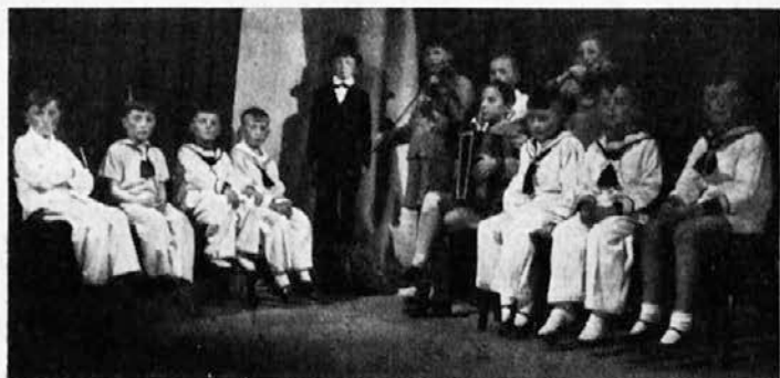
Gospod ravnatelj govori prvoobhajancem. (Iz igrice »Sveti Krištof«.)