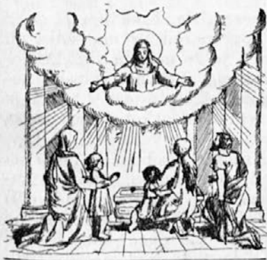
Bolniki na grobu sv. Eme.

brisala solze, onemela so usta, ki so nešteto-krat zagovarjala njihove pravice. Onemogle so noge, ki se niso nikdar utrudile, če je bilo treba pohiteti na pomoč, ko so jih zati-rali neprijatelji. Pre-nehalo je biti srce, ki je bilo tako polno lju-bezni do slovenskega naroda, do njihovih ubožcev, bolnikov in otrok.