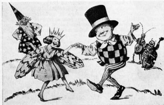
Čebelica-kraljična mu je podala ročico.

nil je v slovo angelčku in kačjemu pastirju in stopil pred dostojanstvenega možica, ki ga je pritisnil na srce in trikrat vroče poljubil. Medtem so prišli hrošči vseh vrst in prinesli prelep naslanjač, v katerega je posadil bradač veselega Balončka. Kdo bi si mislil — bradač je bil dirigent, kapelnik in pevovodja. Vzel je v roko tenko paličico in okrog njega se je zbrala cela vrsta muzikantov. To so