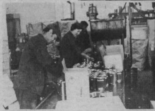
V tozdu Belles so že začeli z gradnjo sodobnega skladišča vnetljivih surovin, potrebnih za izdelavo sadolina in drugih premaznih sredstev za zaščito lesa. Tudi proizvodnja teh izdelkov bodo letos razširili, z modernizacijo pa se bo output povečal za 30 odstotkov. Zahteve jugoslovanskega trga namreč tako hitro naraščajo, da proizvodnja že sedaj ne sledi zahtevam. Postavili bodo še novo polnilno linijo, kakajno le na dovoljenje za uvoz.

Tozd Belles potrebuje še novo skladišče potrošnega blaga, ker so sedanje površine in njihova razmestitev premajhne in neustrezne. Tudi rezervne dele za stroje imajo sedaj shranjene na različnih krajih. Imajo že nekaj idejnih projektov, vendar pravega še niso izbrali. Skladišče bodo zgradili v dveh fazah, najprej pa skladišče gotovih izdelkov. Le-to bo zelo moderno, posodobili pa bodo tudi postopke konzerviranja in odprave blaga. Staro skladišče (na sliki) se bo moralo umakniti.