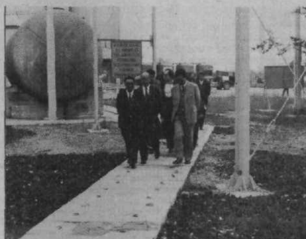
Pred nedavnim je Belinko obiskala kitajska delegacija, ki so jo sestavljali predstavniki kemične industrije. Obiskali so namreč nekaj večjih tovrstnih organizacij združenega dela v Sloveniji, s katerimi želijo sodelovati ter navezati vrsto konkretnih in koristnih stikov. V Belinki so se predvsem zanimali za proizvodnjo vodikovega peroksida in natrijevega perborata, saj teh tehnologij pri njih še nimajo. Dogovorili so se za nastop Belinke na jugoslovanski razstavi v Pekingu v začetku prihodnjega leta. Do tedaj pa bodo konkretnije povedali, kaj želijo od Belinke: bržkone se bodo dogovorili najprej za uvoz določene količine proizvodov, nato pa za prenos tehnologije.

V Belinki je vsak dan kaj novega, življenje tamkaj teče z velikimi koraki. Danes nov izdelek, jutri skladišni in proizvodni prostori, uvajanje nove proizvodnje in širjenje stare, poslovni obisk s tega ali onega konca sveta... Vmes pa seveda opravljane vsakodnevnih nalog, na videz neopaznih in nepomembnih, v skupnem seštevku pa vendar takih, ki uvrščajo Belinko med uspešnejše bežigrajske organizacije združenega dela.