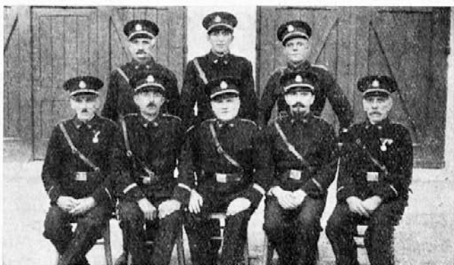
Odbor gasilske čete 1936

Dne 5. julija t. l. na svidenje v Novem mestu!