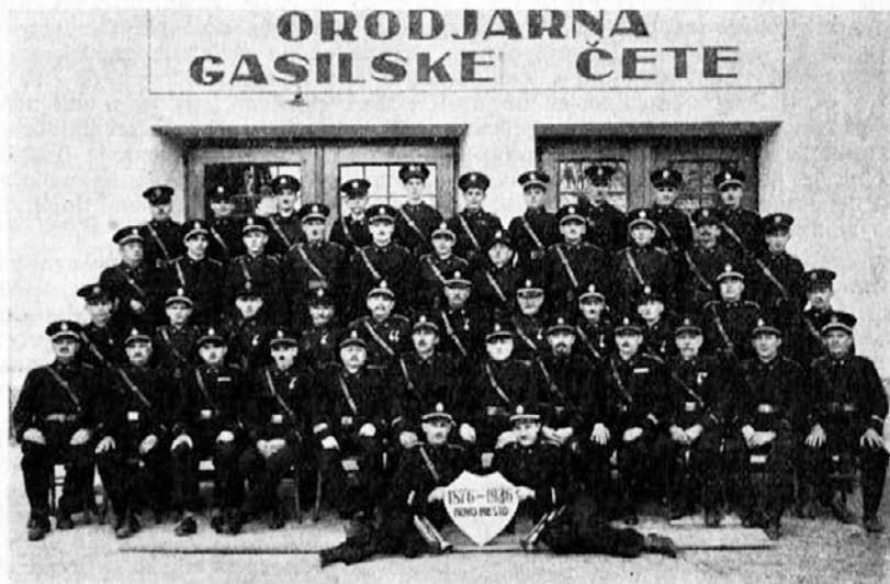
Članstvo čete 1936